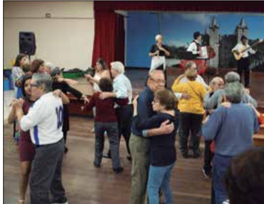
Panorâmica dos "Pés de Valsa" no salão Feirense