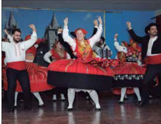
Verdadeiro Show de Folclore do R.F. Maria da Fonte