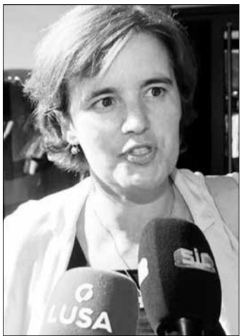
todas estas áreas participem na reconstrução, afirmou.

A pós reunir, em Manteigas, com os presidentes de câmara dos 5 concelhos mais afetados pelo incêndio da serra da Estrela, para avaliar os prejuízos causados e definir medidas de apoio, a ministra da Presidência, Mariana Vieira da Silva, informou que durante os próximos 15 dias será feito um levantamento de todos os danos e prejuízos deste incêndio. Só depois do levantamento dos prejuízos, que será feito pelos organismos do Estado em parceria com os municípios, é que o Executivo irá aprovar um conjunto de medidas, ao abrigo do estado de calamidade, que será decretado no próximo Conselho de Ministros, disse a ministra no final da reunião, sem referir os calendários e os territórios que vão ser abrangidos, referindo ser necessário fazer primeiro um diagnóstico da situação. Estado de calamidade dará condições para que todos, Estado e autarquias, possam responder às necessidades deste território. "Essa é a garantia principal que aqui trouxemos várias áreas do Governo", continuou a ministra, acrescentando que a intervenção tem de ser integrada, da Agricultura ao Ambiente, do Trabalho e Solidariedade à Coesão Territorial, a Administração Interna. É fundamental que