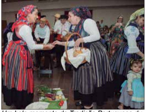
Um belo momento da Tradição Portuguesa durante a merenda

Imensos parabéns a todos os envolvidos!!! Que venham mais dias como estes.