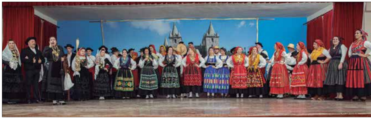
No Palco da Casa da Vila da Feira com seus belos trajes o Rancho Folclórico Maria da Fonte