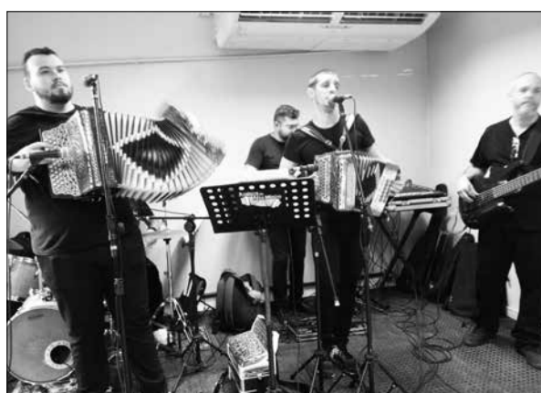
O Conjunto Amigos do Minho, abrilhantou o domingo das familiares na Casa de Espinho

A Casa de Espinho, realizou o seu tradicional almoço de convívio social, no último dia 13, com a Casa cheia, os amigos desfrutando de tremoços, caipirinha e tira gosto, os componentes animados e a diretoria na empolgação de mais uma festa na Casa. A Casa teve seu bufê variado com churrasco e sardinhas na brasa, a animação ficou com o conjunto Amigos do Alto Minho e só faltou o folclore, com o G.F. Fausto Neves da Casa de Espinho, mas no dia 11 de dezembro um grande festa para festejar os 59 anos de fundação, G.F. Fausto Neves, imperdível.