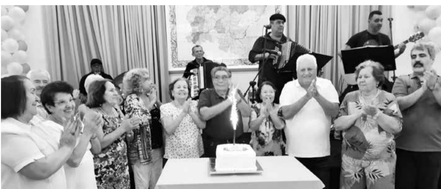
Diante do bolo comemorativo aos vemos os aniversariantes