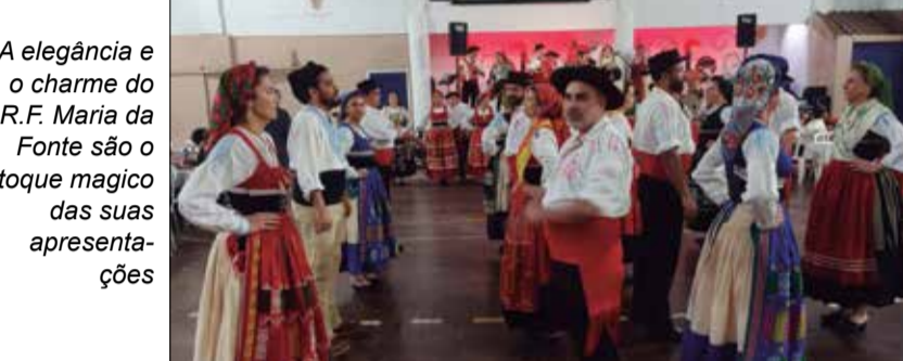
A elegância e o charme do R.F. Maria da Fonte são o toque magico das suas apresentações