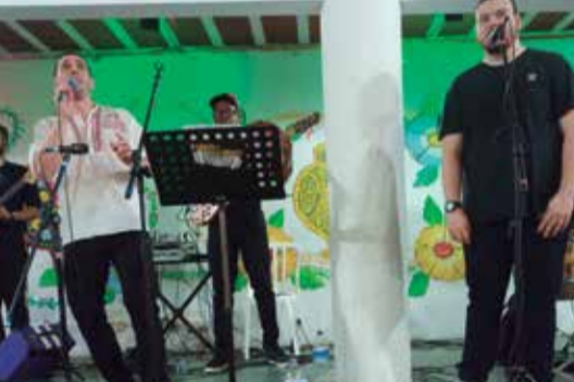
O Conjunto Amigos do Alto Minho agitou pra valer o Arraial Minhoto