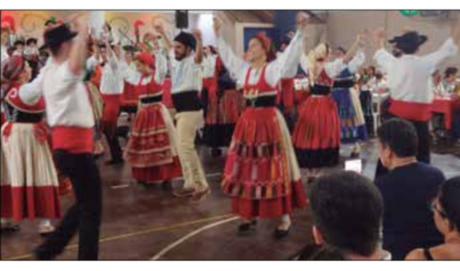
A atração especial da noite foi o show do R.F. Maria da Fonte

Um arraial tipicamente português, a Quinta de Santoinho, aconteceu mais uma vez no último sábado, na Casa do Minho. A animação se repete na Casa da rua Cosme Velho, todo primeiro sábado de cada mês. Com o estacionamento lotado e muitos turistas, a Quinta de Santoinho já é um programa recomendado por alguns agentes de turismo do Rio de Janeiro. Imperdível! Nas amplas instalações da Casa do Minho o visitante logo se sente à vontade optando entre o salão, naquela noite repleto, a beber um dos três tipos de vinho. Presentes na Quinta de Santoinho estavam o conjunto Amigos do Alto Minho que garantiu a animação com vasto repertório. O rancho folclórico minhoto acompanhando pela tocata da Casa fez um "aquecimento" junto ao público com seus sanfoneiro de bombo, ferrinho, etc... Não faltaram os conhecido bonecos, também muito tradicionais, mostrando a alegria das danças e cantares de Viana do Castelo e do Minho em geral tomam conta do ambiente. Com a exibição no sábado do Rancho Minhoto, como podemos ver, o que não falta à Quinta de Santoinho é muito calor das nossas tradições!