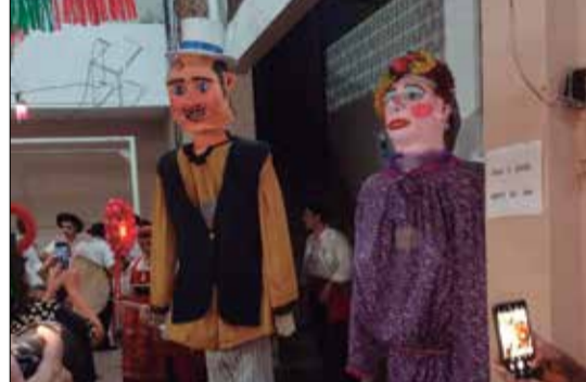
Os bonecos gigantes, são uma das atrações do Arraial da Quinta de Santoinho