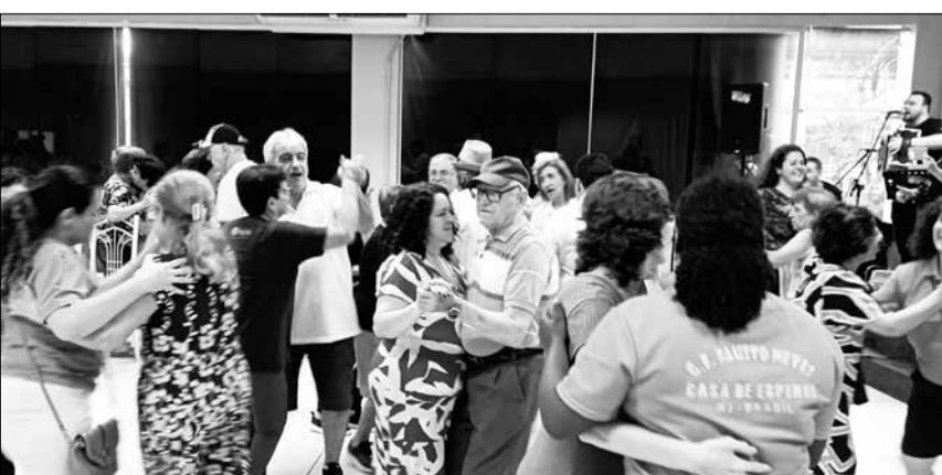
Diversas famílias estiveram prestigiando o convívio social mensal na Casa de Espinho