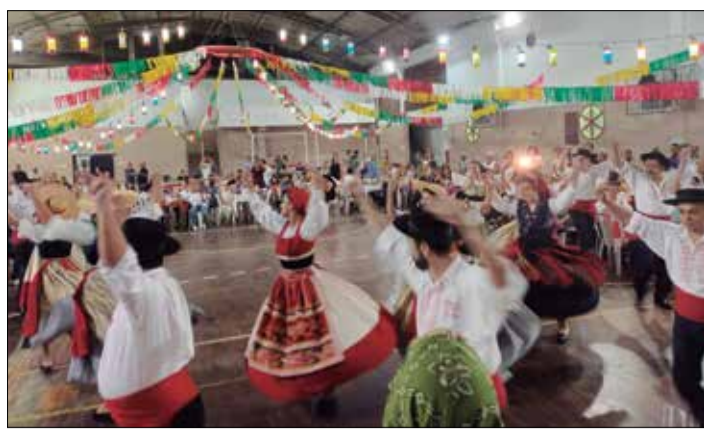
O R.F. Maria da Fonte sempre dando aquele show de folclore