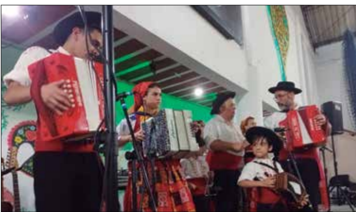
A Tocata Minhota e um show a parte