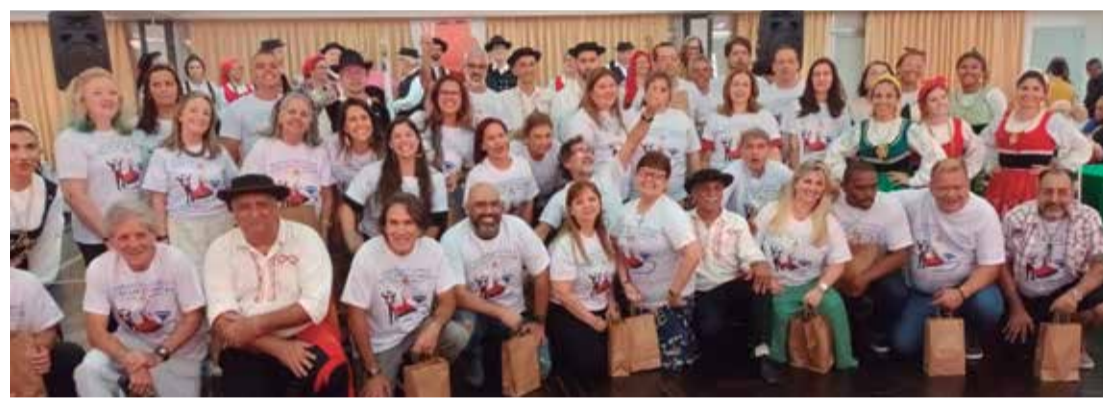
Momento incrível com os ex-componentes do R.F. Luís de Camões reunidos para uma foto de recordação com todos atuais componentes