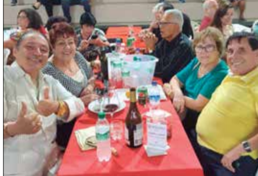
Um clima muito especial na Quinta de Santoinho com a presença de diversos familiares