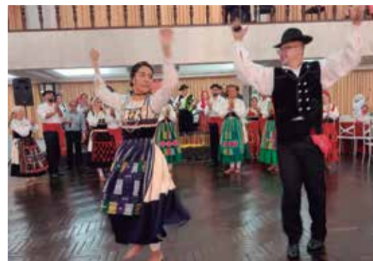
A apresentação maravilhosa do R.F. Luís de Camões nesta linda Festa na tarde de domingo no C.P.N.

G.F. Luís de Camões estava animadíssimo e apresentou vários números interessantes, mas a grande marca da festa, foram os ex-componentes do grupo, eram muitos e estavam bem felizes pelo convite, e ainda dançaram juntos, realmente a festa foi muito bonita, todos no Clube ficaram emocionados com este momento.