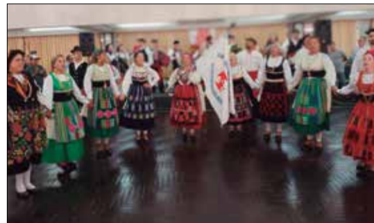
Momento da entrada do R.F. Luís de Camões, na festa de 40 anos de fundação, recebendo todo o carinho do público, que show parabéns rapaziada