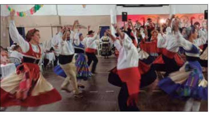
Um verdadeiro espetáculo de folclore apresentado pelo R.F. Maria da Fonte