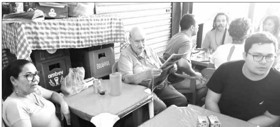
Mesa de destaque dos amigos, no sábado, no Cantinho das Concertinas, onde o público, cada vez mais procura um "cantinho" para matar saudades de Portugal

Outro belo fim de semana, super movimentado, na Aldeia Portuguesa do Cadeg. Cada sábado que passa, o Cantinho das Concertinas do Cadeg recebe mais e mais amigos a cada fim de semana, onde se vai renovando com muita gente reunida para saborear a deliciosa gastronomia portuguesa e brasileira, que você só encontra no Cadeg, com opção de desfrutar de excelentes restaurantes portugueses onde você encontra vinhos, cervejas portuguesas e diversas iguarias de ótimas proce-