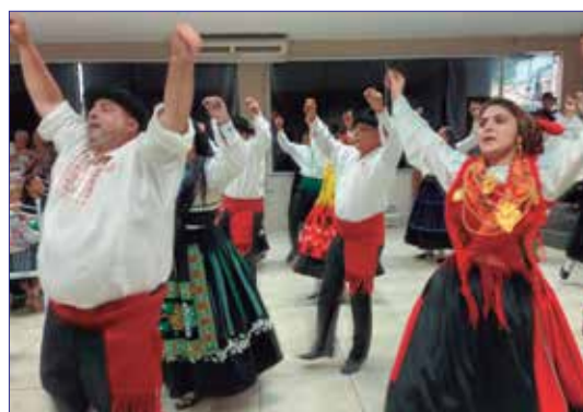
Apresentação magistral do G. F. Serões das Aldeias no convívio na Casa de Espinho