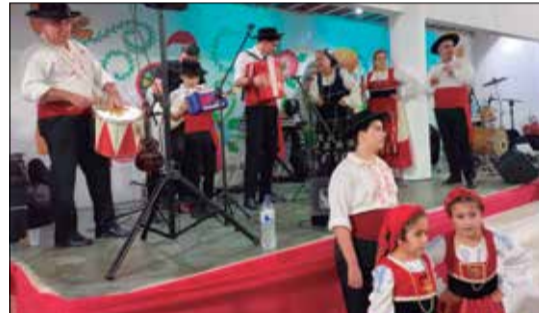
A Tocata Rancho Folclórico Maria da Fonte e sempre um show