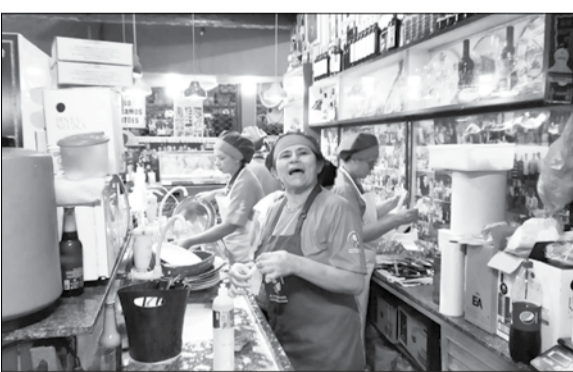
Uma equipe de colaboradores que trabalha com afinco e dedicação