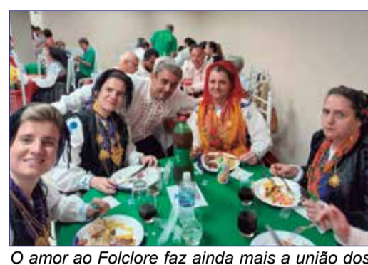
O amor ao Folclore faz ainda mais a união dos folcloristas do G.F. Serões das Aldeias