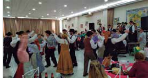
Que Show desses "componentes", pois já tem o folclore no coração e na alma

ponentes do Grupo realizaram uma belíssima apresentação, festejando mais um ano de fundação! Que show, parabéns para todos os componentes que dedicam-se em divulgar as tradições portuguesas no Brasil. Nota 10 para a diretoria transmontana pelo apoio a esses jovens luso-brasileiros