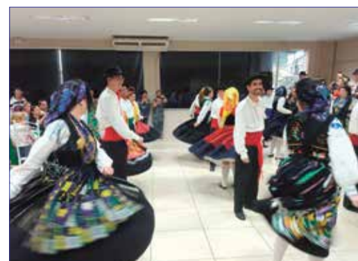
Um verdadeiro espetáculo de Folclore apresentado pelo G.F. Serões das Aldeias