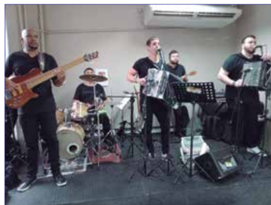
O Conjunto Amigos do Alto Minho, mandou ver no Almoço Dançante da Casa de Espinho, com belo repertório

Casa de Espinho mais a tarde reservava um grande show de Folclore com o G.F. Serões das Aldeias que realizou uma das mais belas apresentação que espetáculo que elegância que charme, que empolgou o público presente, com certeza todos que prestigiaram o Almoço Dançante ficaram maravilhados com toda organização e o show do G.F. Serões das Aldeias.