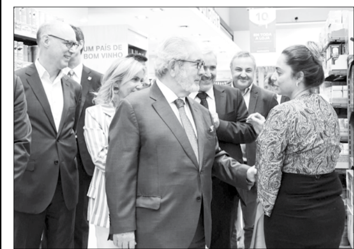
Oeiras tem um novo Continente Bom Dia. Na passada quinta-feira, dia 28 de setembro, em Carnaxide, foi inaugurado este novo espaço