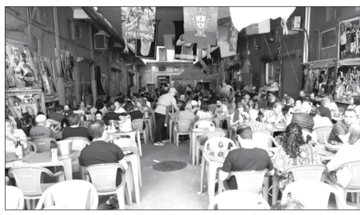
Panorâmica da famosa Aldeia Portuguesa do Cadeg