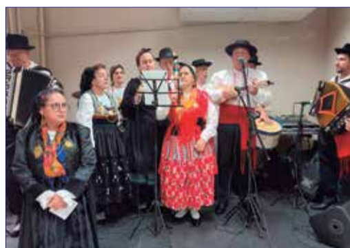
As cantadeiras do G.F. Serões das Aldeias entoando os lindos cantares do folclore português