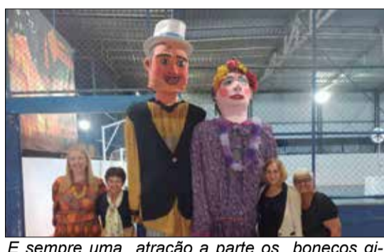
É sempre uma atração a parte os bonecos gigantes

Seja na comunidade portuguesa do Rio de Janeiro, ou seja, em Portugal, a festa de Santoinho é, de fato, uma grande festividade que milhares de pessoas têm por hábito se juntarem no Minho, alegremente, nesta tão característica tradição minhota. Uma tradição que se repete (apesar das suas dimensões mais reduzidas) no Rio de Janeiro, em virtude da iniciativa da Casa do Minho, que representa, e muito bem, toda aquela verdejante e peculiar região portuguesa. No passado sábado, à noite, a Casa do Minho teve mais uma realização deste gênero: a Quinta de Santoinho – o tradicional Arraial Típico da Casa e de toda a comunidade portuguesa. Quase não será necessário falar da sardinha portuguesa, do caldo verde ou mesmo dos afamados vinhos portugueses, com especial incidência nos néctares da região minhota. Verdadeiras delícias para o paladar tão bem apurado, como é o dos portugueses. Neste aspecto