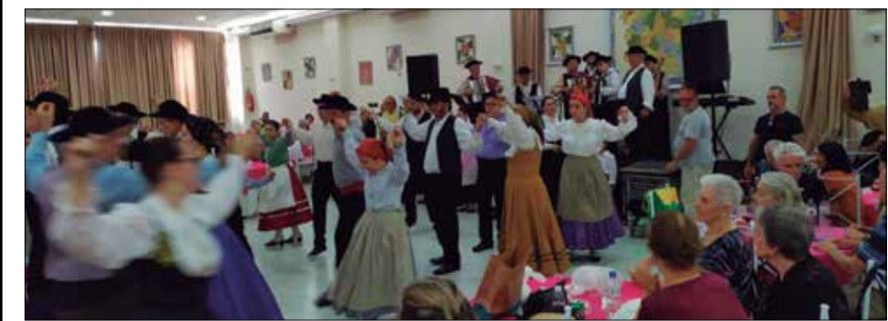
Mas um brilhante apresentação, do G.F. Guerra Junqueiro, no domingo passado