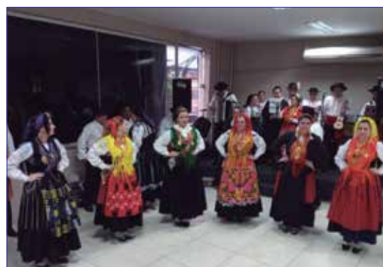
Componentes do G.F. Serões das Aldeias, numa linda posse para o Jornal Portugal em foco