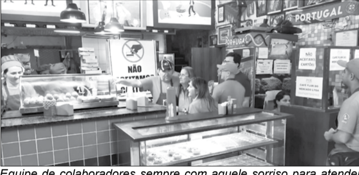
Equipe de colaboradores sempre com aquele sorriso para atender os clientes

os presente que lá vão para uma tarde de muita alegria.