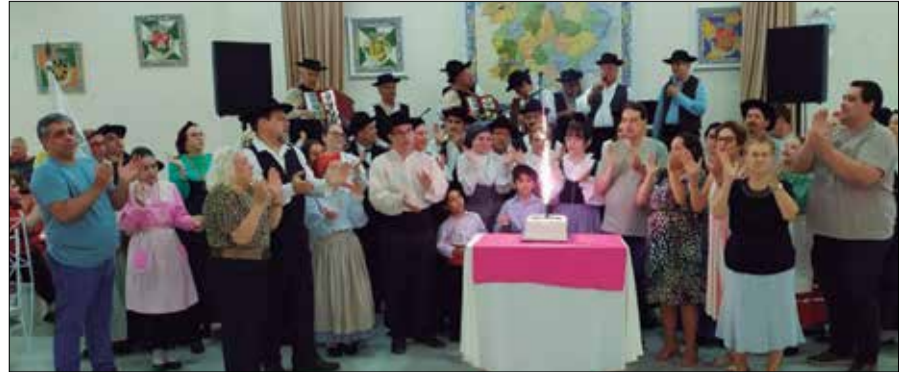
Momento dos parabéns com os aniversariantes do mês, os componentes G. F. Guerra Junqueiro reunidos diante do bolo festivo, comemorativo aos seus 61 anos de fundação