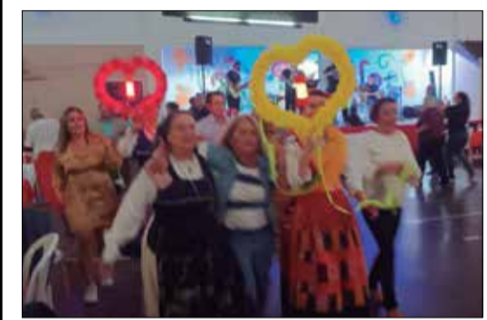
Momento maravilhoso, no Arraial minhoto com desfile dos arcos

Seja na comunidade portuguesa do Rio de Janeiro, ou seja, em Portugal, a festa de Santoinho é, de fato, uma grande festividade que milhares de pessoas têm por hábito se juntarem no Minho, alegremente, nesta tão característica tradição minhota. Uma tradição que se repete (apesar das suas dimensões mais reduzidas) no Rio de Janeiro, em virtude da iniciativa da Casa do Minho, que representa, e muito bem, toda aquela verdejante e peculiar região portuguesa. No passado sábado, à noite, a Casa do Minho teve mais uma realização deste gênero: a Quinta de Santoinho – o tradicional Arraial Típico da Casa e de toda a comunidade portuguesa. Quase não será necessário falar da sardinha portuguesa, do caldo verde ou mesmo dos afamados vinhos portugueses, com especial incidência nos néctares da região minhota. Verdadeiras delícias para o paladar tão bem apurado, como é o dos portugueses. Neste aspecto