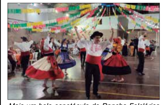
Mais um belo espetáculo do Rancho Folclórico Maria da Fonte, no Arraial Minhoto, ao som da Tocata da Casa