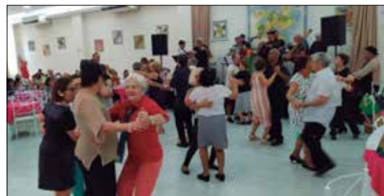
Panorâmica do salão social da Casa de Trás-os-Montes com muita gente dançando

Mais um grande dia no Solar Transmontano da rua Mello Matos, com a realização de mais um almoço dos aniversariantes, onde aqueles que completam nova idade, recebem a homenagem dos transmontanos, com muita alegria, descontração e tranquilidade das famílias que comparecem a estes eventos. Sempre uma grande festa, com muita animação, oferecendo aos que lá comparecem, um excelente cardápio e opções. Uma grande confraterni-