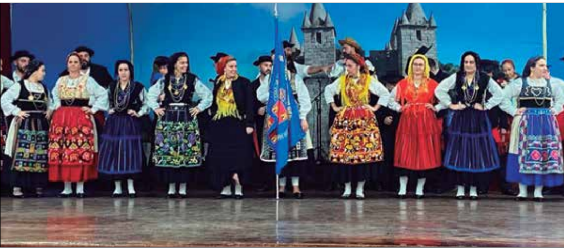
No Palco da Casa da Vila da Feira o Grupo Folclórico Almeida Garrett