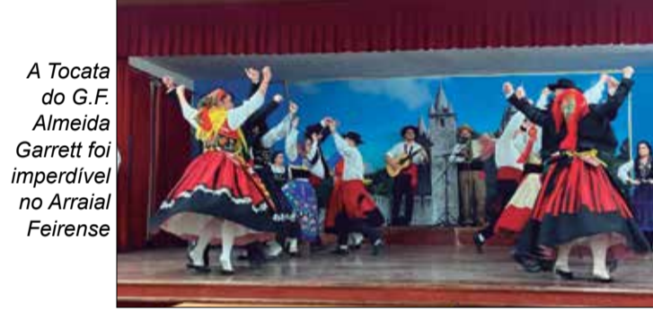
A Tocata do G.F. Almeida Garrett foi imperdível no Arraial Feirense