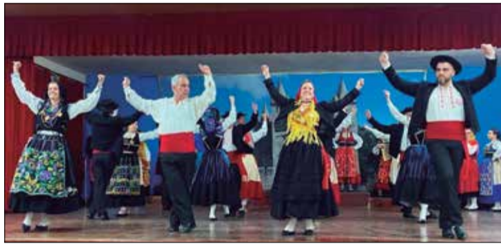
Apresentação perfeita o G.F. Almeida Garrett, na Quinta do Castelo