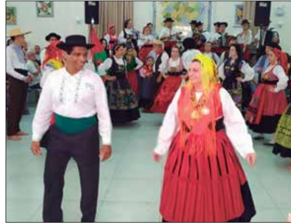
Apresentação de gala do G.F. Serões das Aldeias