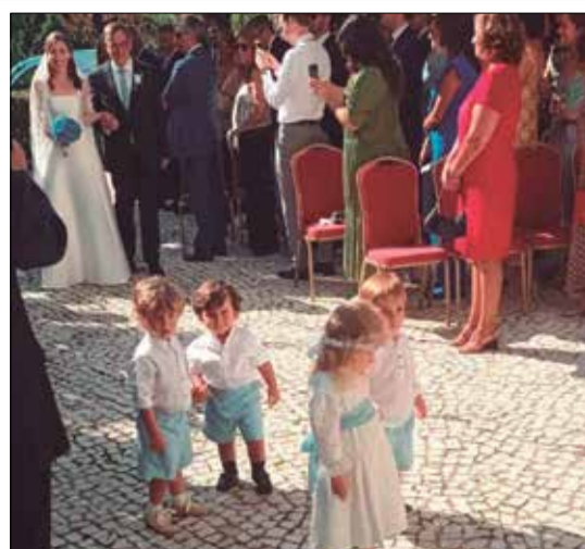
O charme do enlace no Curia Palace Hotel Spa & Golf, os lindos pajens e a daminha de honra