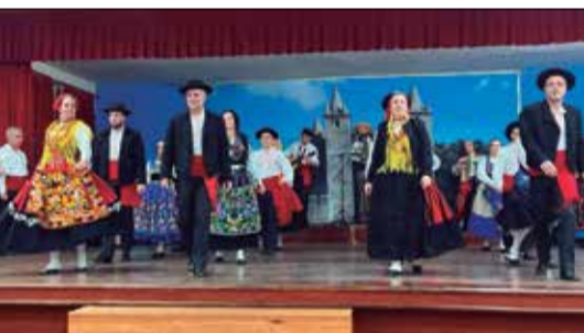
Os trajes do G.F. Almeida Garrett, são simplesmente belíssima