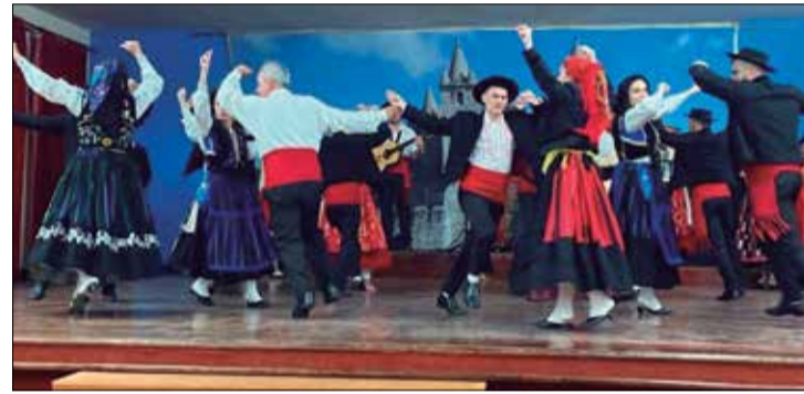
Verdadeiro espetáculo de Folclore das Componentes do G.F. Almeida Garrett