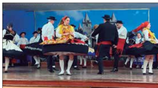
Simplesmente fantástica a apresentação do G.F. Almeida Garrett