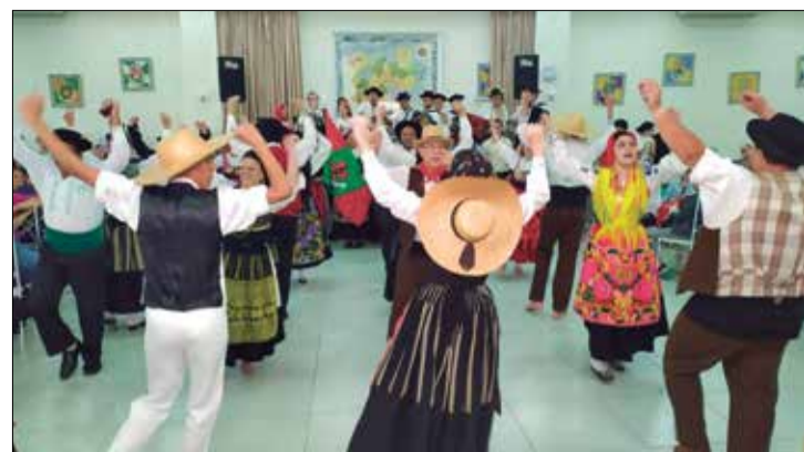
Show de folclore do G.F. Serões das Aldeias na Casa de Trás-os-Montes

Domingo de Casa cheia no Solar Transmontano com grande Festa do G.F. Serões das Aldeias com público chegando em peso para saborear um delicioso churrasco, sardinha portuguesa na brasa, febras. Tudo perfeito preparada no capricho, um show de organização dos Diretores do G.F. Serões das Aldeias, tarde bem animada com a presença do Conjunto Amigos do Alto Minho, que o toque musical ao almoço. Mais o ponto alto desta grande festa foi a apresentação magnífica do G.F. Serões das Aldeias, com verdadeiro show de folclore português, trazendo toda essência da cultura portuguesa para benzer a Diretoria competentes do G.F. Serões das Aldeias e o Jornal Portugal em Foco, trás nesta página alguns destaques.