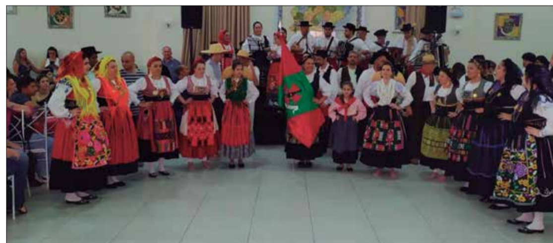
Panorâmica do Salão Social com o Conjunto Amigos do Alto Minho agitando o público