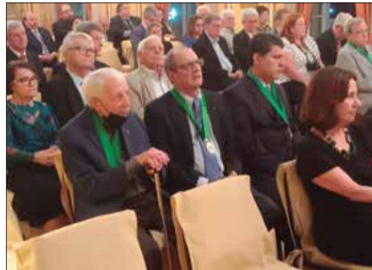
Diretores, e Presidentes das Casas Regionais, e diversos segmentos da Comunidade Portuguesa estiveram presentes no Palácio São Clemente