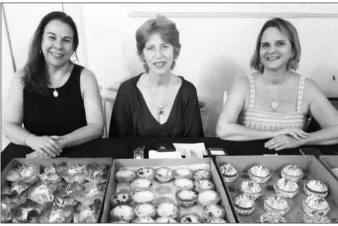
O departamento feminino feirense sempre , ativo vendendo os deliciosos doces portugueses