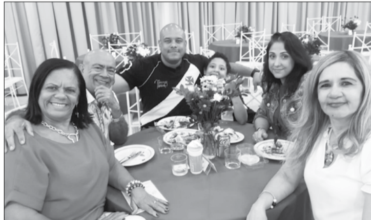
Amigos e parentes da aniversariante do dia que veio celebrar seu aniversário na Casa de Trás-os-Montes