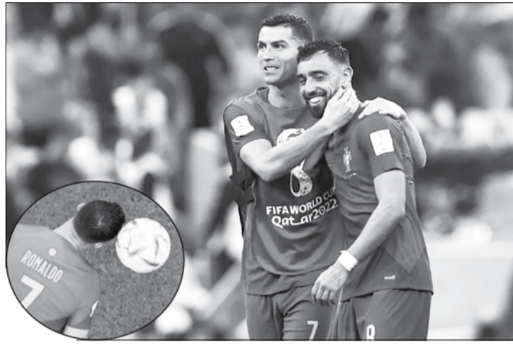
Após lance ser creditado a Bruno Fernandes, astro diz a jornalista que tocou na bola. Comissão da Fifa ainda fará análise detalhada para definir autor do gol

Bruno Fernandes é o protagonista do time na Copa do Mundo até aqui e mostra que equipe atual vai muito além do camisa 7. Ele é o dono do