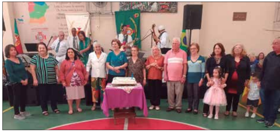
Diante do bolo comemorativo, vemos os aniversariantes do mês durante o tradicional parabéns