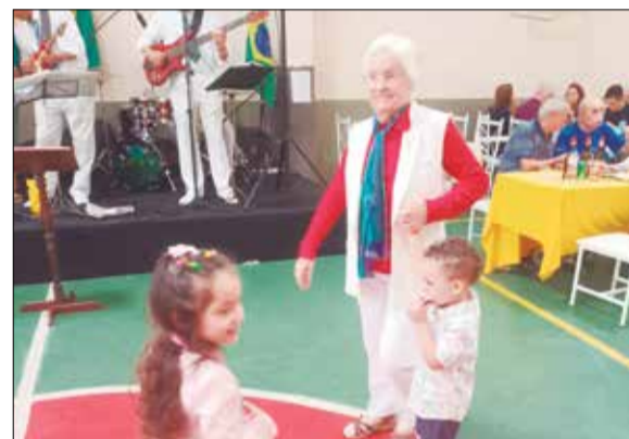
Que ambiente maravilhoso foi o Almoço dos aniversariantes do Orfeão Português, onde as famílias puderam curtir as crianças