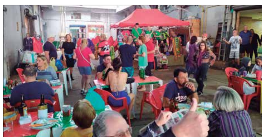
Panorâmica, da Aldeia Portuguesa do Cadeg, sempre lotada recebendo amigos da Comunidade Portuguesa e Luso-brasileira todos os sábados imperdível