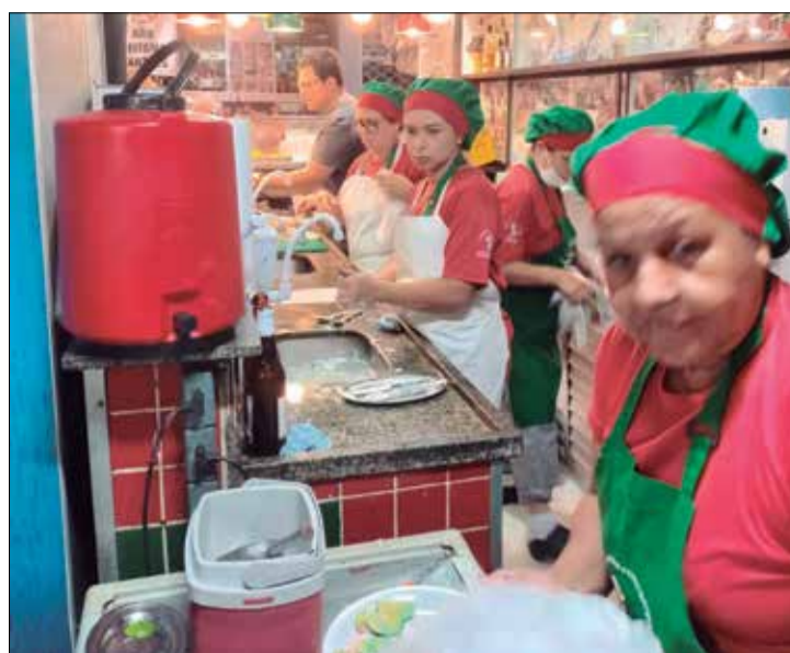
A equipe de colaboradores do Cantinho das Concertina, no Bar do Carlinhos, e show de Bola, vestem a camisa com vontade muita dedicação, um atendimento nota 10 parabéns a todos