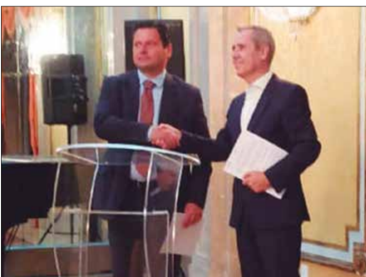
Representantes da Rede Global durante apresentação da diáspora