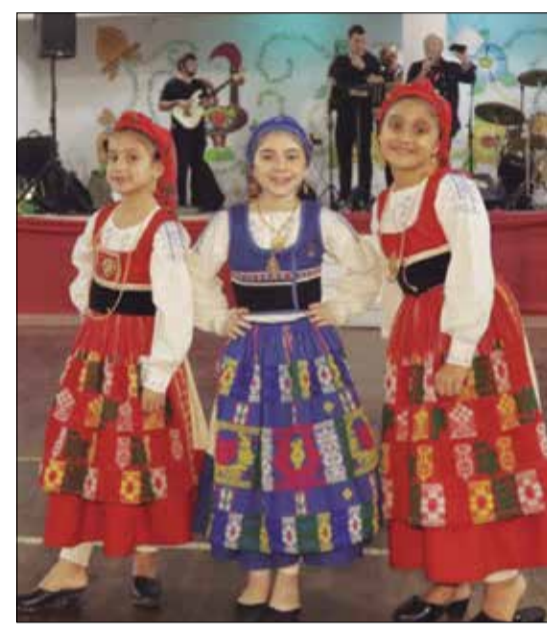
Três princesinhas do R. F. Juvenil da Casa do Minho, no sábado passado na Quinta de Santoinho

O tradicional Arraial Minhoto, Quinta de Santoinho é verdadeiramente, um espaço de tradições portuguesas "transbordantes", onde associados e frequentadores podem passar horas e horas cultuando a saudade do querido Portugal, em especial da terrinha distante... Na noite do passado sábado, dia 3 a Quinta de Santoinho trouxe mais uma vez as suas delícias da culinária (sardi-