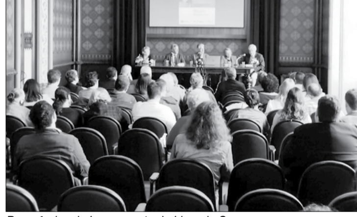
Panorâmica do Lançamento do Livro do Saramago