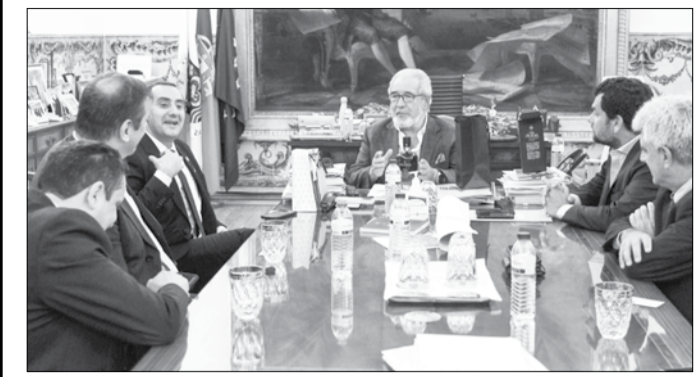
A visita do político brasileiro teve lugar no âmbito do programa avançado de Estudos Espaciais, Space Studies Program (SSP)