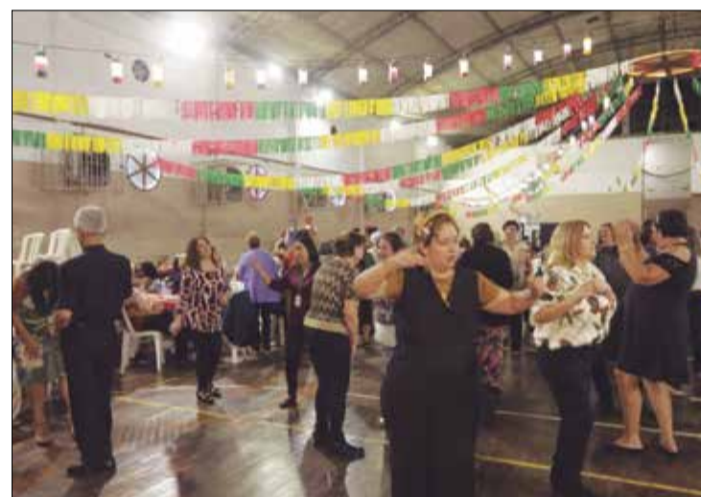
Arraial Minhoto é sempre uma grande Festa com o público sempre interagindo

na portuguesa na brasa, caldo, verde, broa, vinhos e outras opções), o folclore ficou por conta do Rancho da Casa do Minho. Ir à Casa do Minho, em noite de Quinta de Santoinho é programa nota dez. A localização ajuda. Na Rua Cosme Velho, no Cosme Velho, entre o Túnel Rebouças e o Santa Bárbara, dispo de amplas instalações, ideal pra