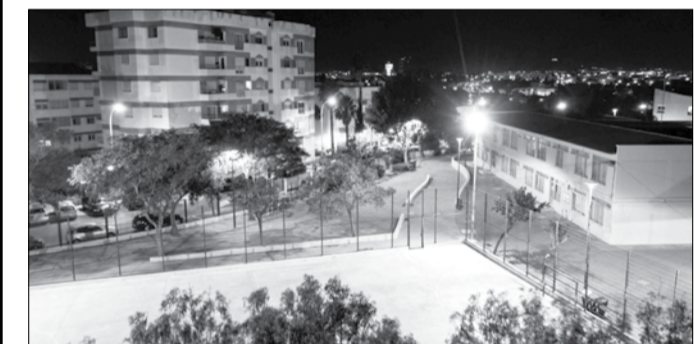
A iluminação dos recintos escolares visa garantir aos municípios a visibilidade suficiente para detetar obstáculos e identificar outras pessoas

Sabia que o sistema de iluminação exterior dos recintos escolares se encontra sincronizado com o horário da iluminação pública?