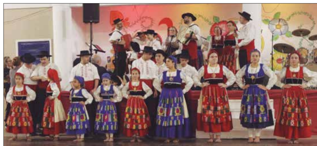
Linda imagem com os componentes do Rancho Juvenil perfilados num registro fotográfico

A Rede Global da Diáspora é um projeto promovido pela Fundação AEP, apoiado pelo Portugal 2020, no âmbito do COMPETE 2020 - Sistema de Apoio às Ações Coletivas, cofinanciado pelo Fundo Europeu de Desenvolvimento Regional.