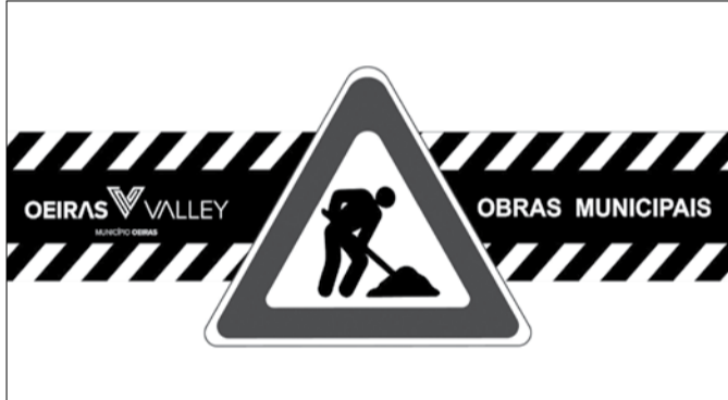
A obra vai dotar o arruamento de melhores condições de circulação automóvel e pedonal, maior conforto e segurança para os utilizadores

O Município de Oeiras vai proceder à beneficiação de pavimentos na Rua Bulhão Pato, em Oeiras, dotando o arruamento de melhores condições de circulação automóvel e pedonal, maior conforto e segurança para os utilizadores.