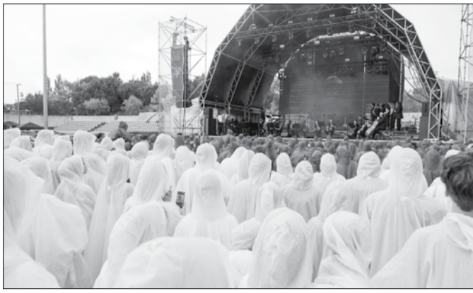
O Festival 'Connect for Ukraine' é um evento solidário que se prolonga até ao próximo dia 28 de agosto, em Oeiras