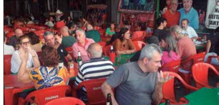
Panorâmica do Cantinho das Concertinas sempre recebendo um excelente público

melhor. Não só pela gastronomia que oferece aos seus clientes e amigos, mas pela oportunidade de se passar momentos agradáveis ao lado de familiares e novos com-