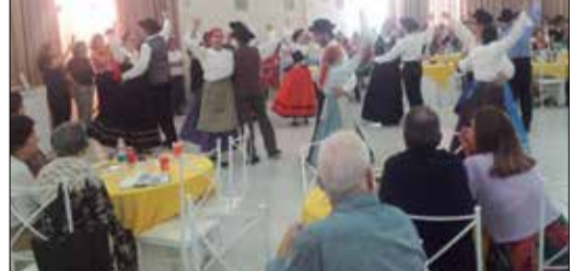
O publico presente no Solar Transmontano vibrou com o show de Folclore