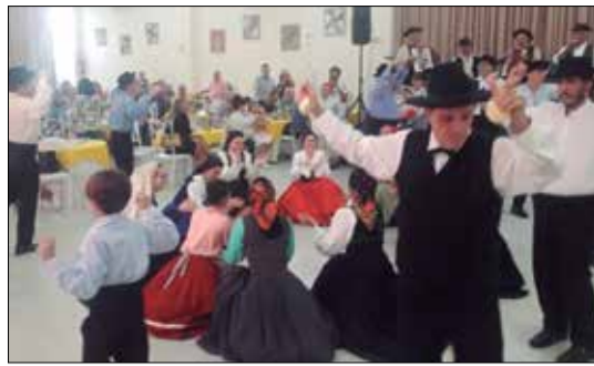
As tradições portuguesas e seus cantares e danças reunido no domingo transmontano