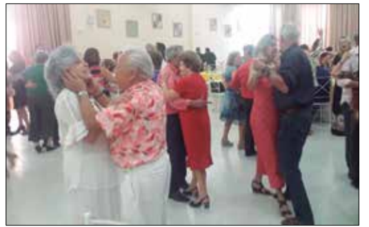
Animação total dos pés de Valsa brilhando no Salão