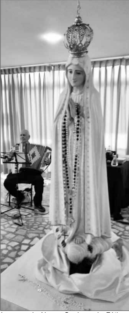
Imagem de Nossa Senhora de Fátima, todo mês louvada no Clube Português de Niterói