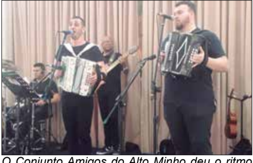
O Conjunto Amigos do Alto Minho deu o ritmo ao Almoço dançante