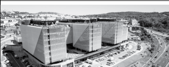
Um dos maiores centros de negócios do país, único no corredor de Lisboa, já está a funcionar