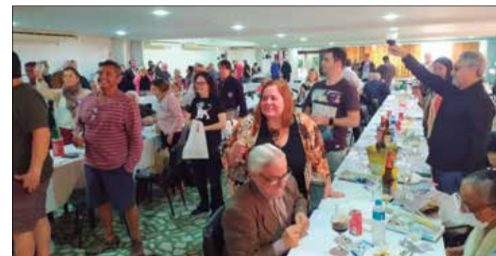
Sucesso total no Almoço Mensal das Quintas no C.P.N. com Clube recebendo um grande público