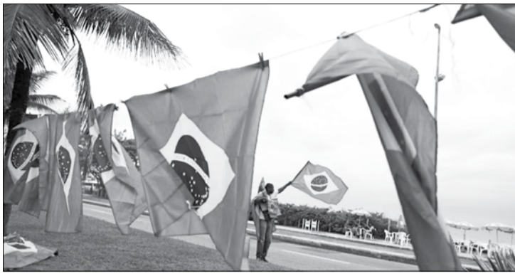
Grande recuperação após queda na pandemia

De acordo com os dados enviados pela Agência para o Investimento e Comércio Externo de Portugal (AICEP), com base em informação do Instituto Nacional de Estatística (INE) e do Banco de Portugal (BdP), o número de dormidas em Portugal aumentou para 1,2 milhões nos primeiros sete meses do ano, um crescimento de 748%