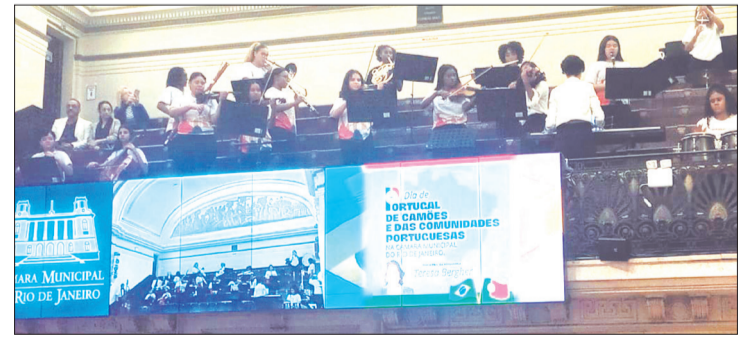
Belíssima participação da Orquestra Juvenil Chiquinha Gonzaga na Câmara Municipal do Rio de Janeiro