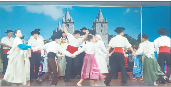
Parabéns aos componentes do R.F.I.J Danças e Cantares das Terras da Feira, pelo lindo show de folclore que apresentaram no Arraial Feirense