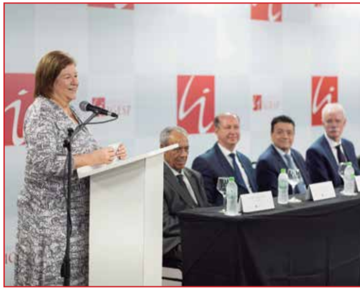
A Prefeita Raquel Chini em seu pronunciamento.