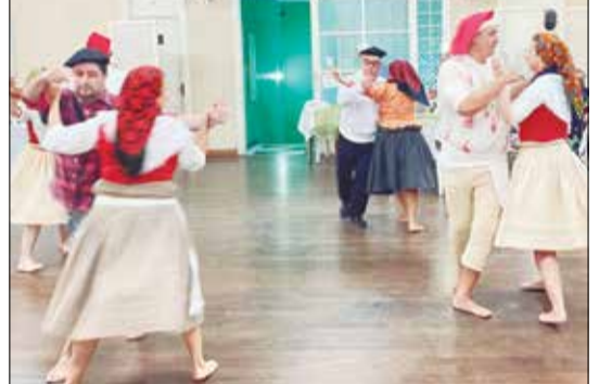
Uma exibição maravilhosa, dos componentes do Rancho Folclórico Eça de Queirós