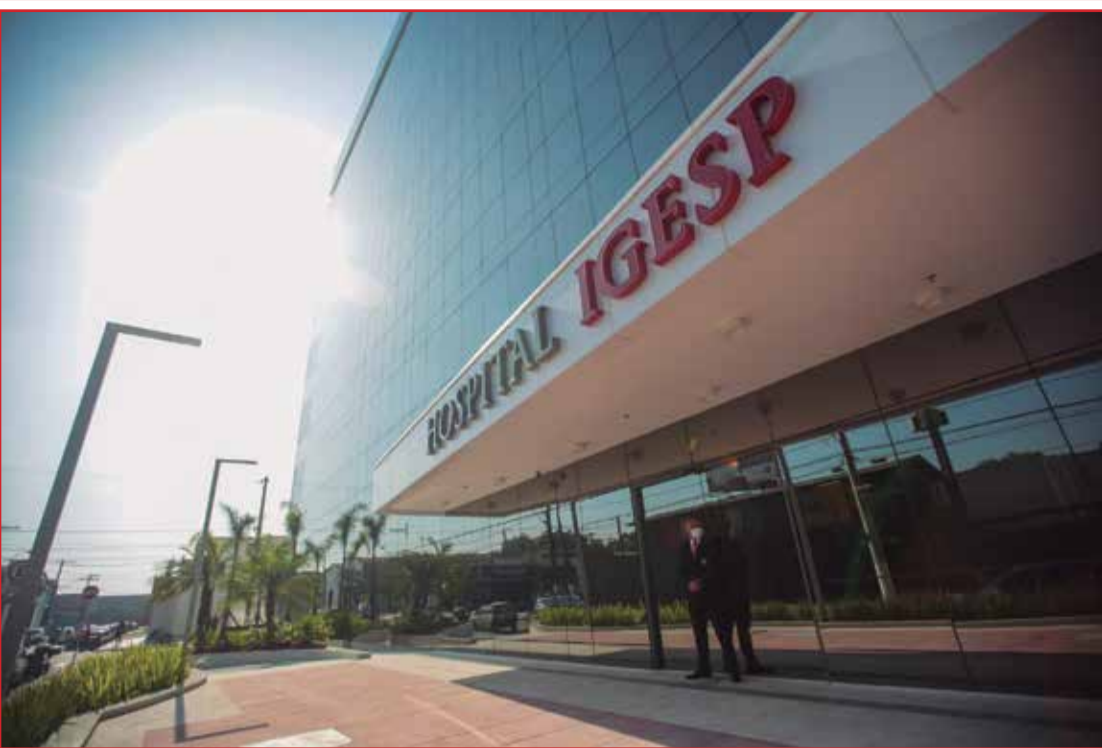
A imponente entrada do Igesp Litoral.

Novo Hospital IGESP Litoral, o melhor e mais completo hospital da Baixada Santista!