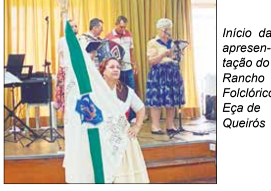
Início da apresentação do Rancho Folclórico Eça de Queirós