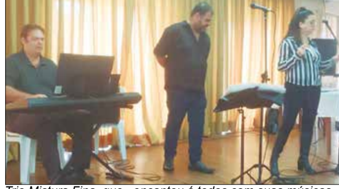
Trio Mistura Fina que encantou á todos com suas músicas