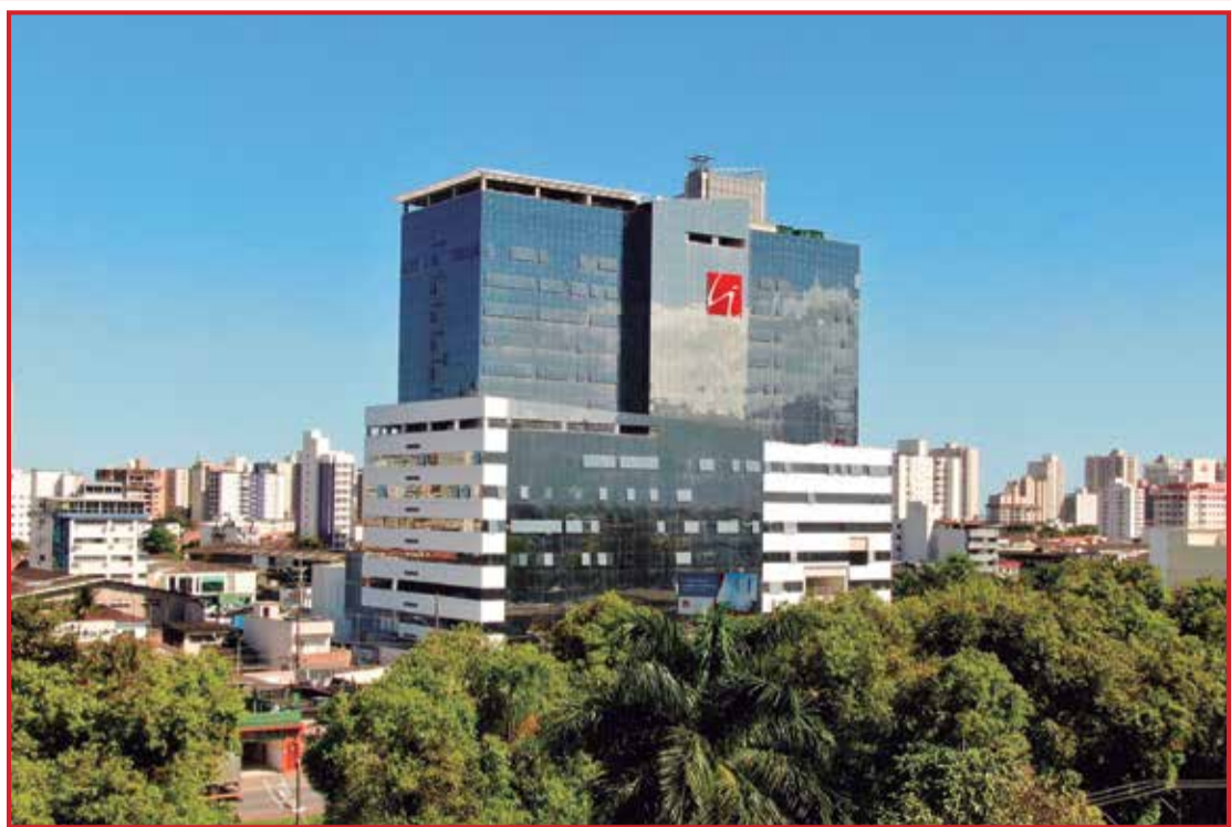
Igesp Litoral o maior e melhor hospital da região.

A inauguração aconteceu no último dia 24 de março em Praia Grande. Esta nova unidade, oferece espaços diferenciados para proporcionar toda a comodidade e conforto, tornando o ambiente hospitalar mais agradável. Com uma infraestrutura moderna e completa, o hospital conta com avançada tecnologia médica para atendimento adulto e infantil. São mais de 34 mil metros distribuídos em 190 leitos de internação geral, obstétrica e pediátrica, Unidades de Terapia Intensiva adulto pediátrica e neonatal. Além de amplo e moderno centro de diagnósticos e serviço de pronto-socorro adulto e pediátrico 24h. O hospital conta com um centro cirúrgico composto por 10 salas equipadas com avançada tecnologia para