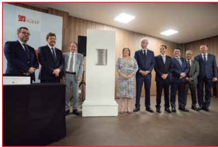
Descerramento da placa inaugural do Igesp Litoral.

Central de Agendamento IGESP Litoral (13) 4042-0999 R. Guadalajara, 453 - Guilhermina - Praia Grande, SP