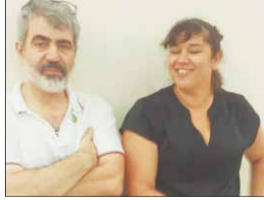
Momento de descontração, no domingo de Páscoa, Presidente Ismael Loureiro, com esposa a primeira dama Sineide