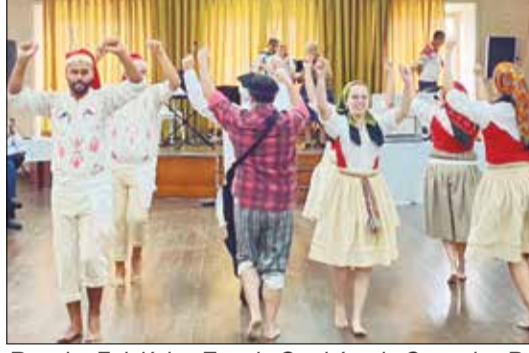
Rancho Folclórico Eça de Queirós, da Casa dos Poveiros do Rio de Janeiro, com a garra de sempre!