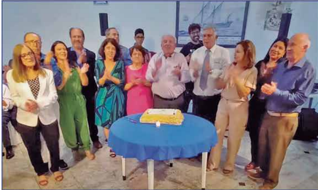
Diretoria dos Poveiros no instante do "Parabéns a Você".