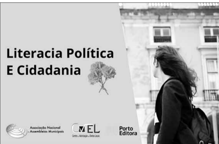
Anam distribui 3000 licenças de formação destinadas a autarcas locais e agentes de formação

ANAM, em colaboração com a Porto Editora, elaborou um curso de Literacia Política e Cidadania, com o objetivo de apoiar a capacitação dos eleitos locais.