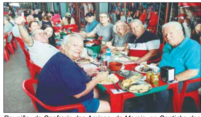
Reunião da Confraria dos Amigos do Morais, no Cantinho das Concertinas, na Sexta - feira no feriado de Tiradentes