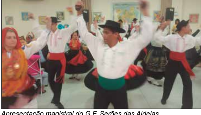
Apresentação magistral do G.F. Serões das Aldeias