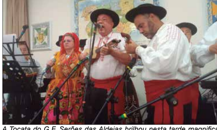
A Tocata do G.F. Serões das Aldeias brilhou nesta tarde magnífica de folclore na Casa de Trás-os-Montes