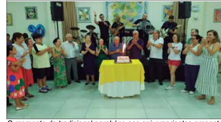
O momento do tradicional parabéns aos aniversariantes presente diante do bolo comemorativo