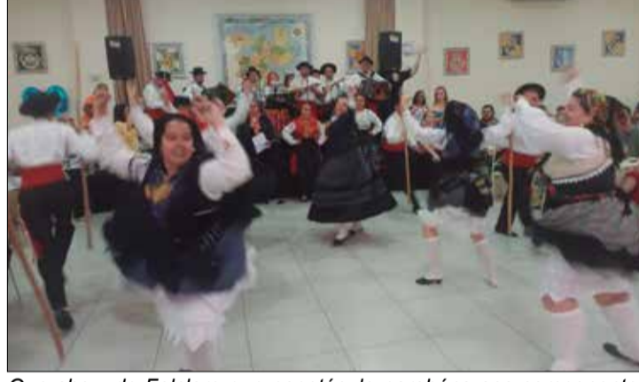
Que show de Folclore que espetáculo parabéns aos componentes do G.F. Serões das Aldeias