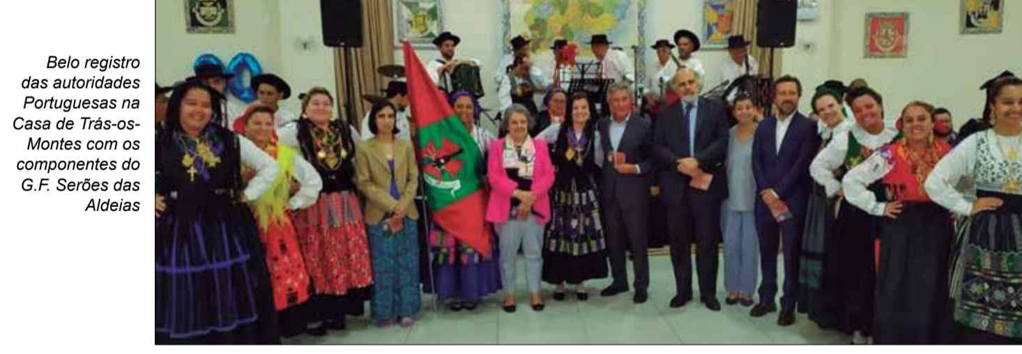
Belo registro das autoridades Portuguesas na Casa de Trás-os-Montes com os componentes do G.F. Serões das Aldeias