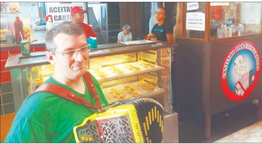
Esta foto mostra quem esta no controle lá no fundo quem controla o dinheiro aqui na frente quem controla as saidas e em primeiro plano quem controla o som