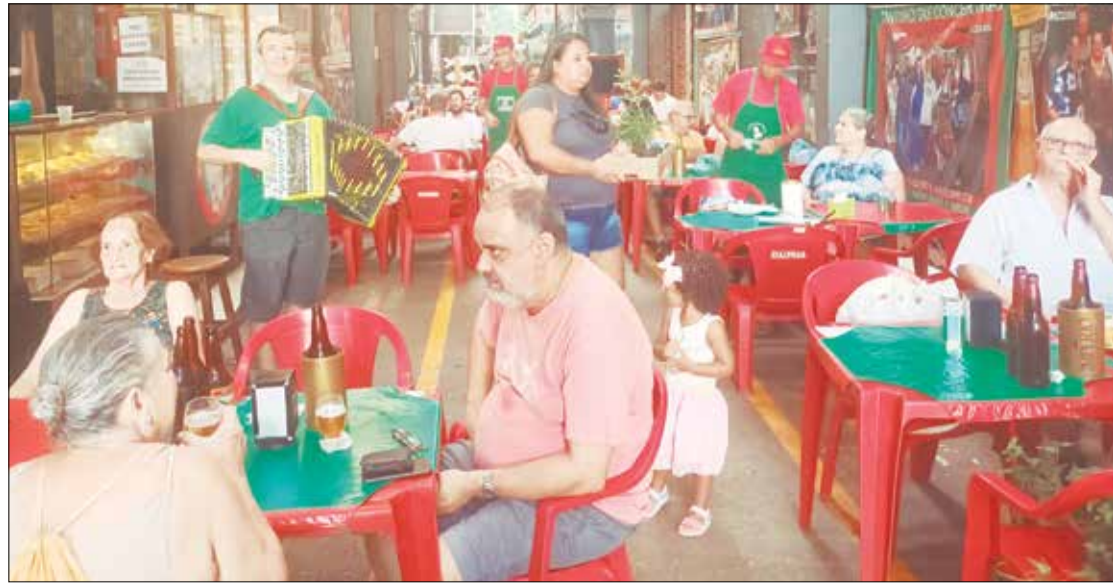
Como dissemos o Cantinho das Concertinas continua enchendo de gente animada com a música