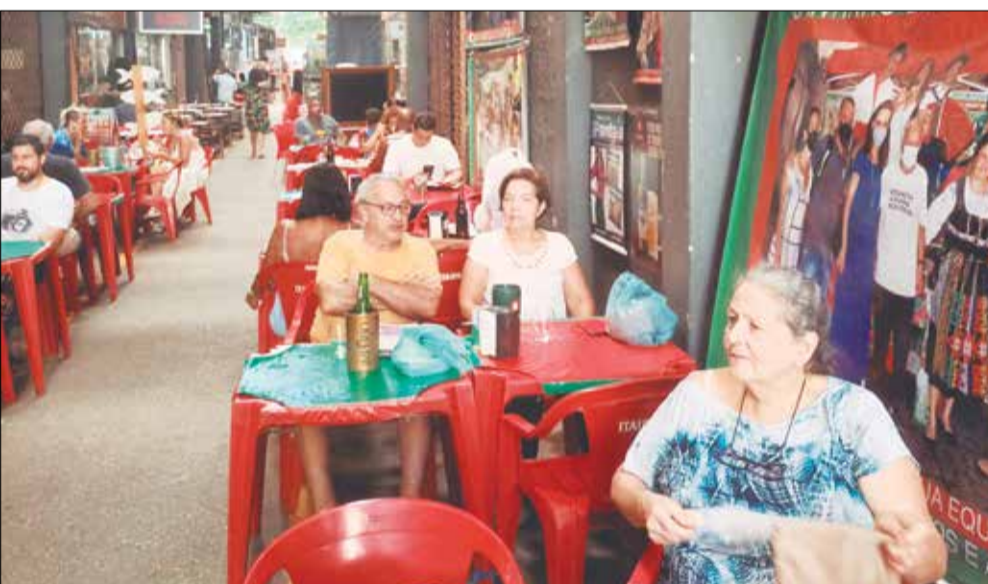
Mais gente curtindo o Cantinho das Concertinas, neste sábado calorento