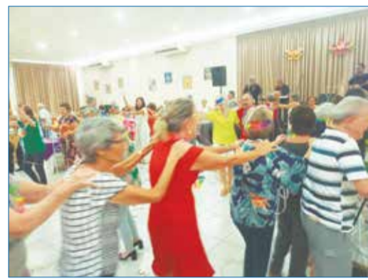
A comunidade Portuguesa, curtindo o baile de carnaval na Casa de Trás os Montes