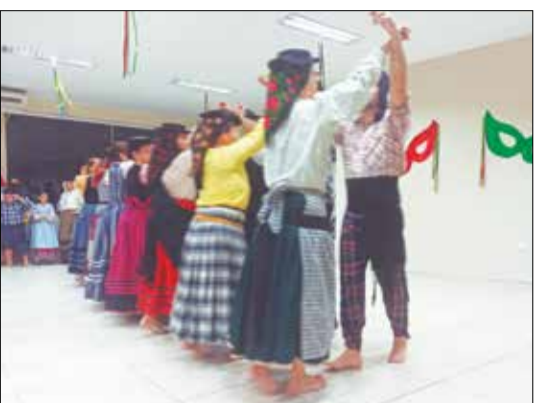
Um verdadeiro espetáculo de folclore, exibindo pelos componentes do R.F. Fausto Neves