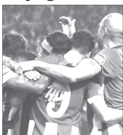
Dragões jogam com o Arsenal no mesmo dia que Barcelona e Nápoles

20 de fevereiro: Inter - Atlético Madrid