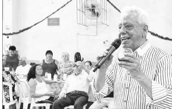
O cantor Romântico para Simões, cantando belas canções no almoço natalino no Orfeão português