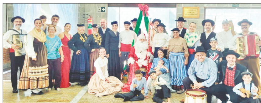
Registro especial no Natal Luz, com os componentes do R.F Camponeses de Portugal reunidos numa bellissima foto