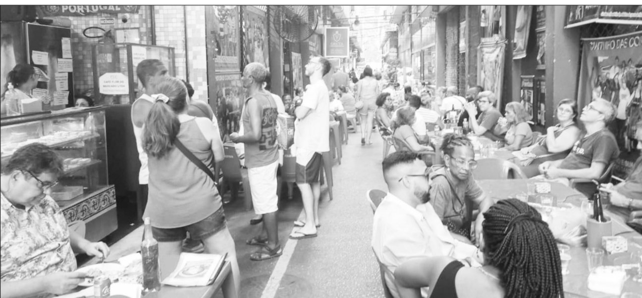
Panorâmica do Cantinho das Concertinas no sábado totalmente lotada