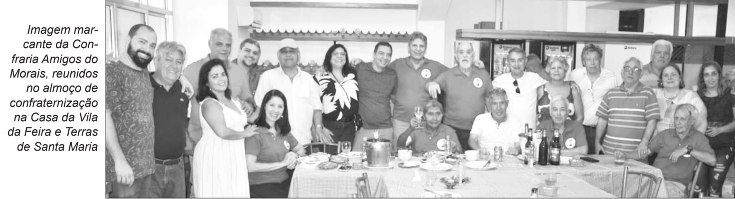
Imagem marcante da Confraria Amigos do Morais, reunidos no almoço de confraternização na Casa da Vila da Feira e Terras de Santa Maria

A Casa da Vila da Feira foi o ponto de encontro da Confraria Amigos do Morais para o almoço de confraternização de Natal. Desta turma que durante o ano inteiro estiveram reunidos para celebrar a vida juntos dos amigos, tornando-se uma verdadeira família. Onde o respeito e camaradagem sempre prevalecer. São momentos de total descontração e muita alegria e satisfação em poder dividir esses encontros de amigos. Foi um pedaço de dia simplesmente espetacular onde todos os presentes extravasaram sua felicidade em poder fazer parte da Confraria dos Amigos do Morais, e em 2024 estará firme e forte fortalecendo ainda mais a amizade vida longa a Confraria dos Amigos do Morais. Destacamos aqui nesta reportagem alguns flaches.