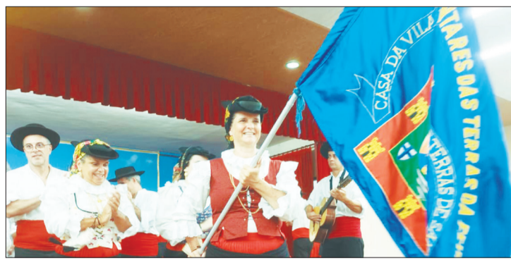
Entrada triunfal do Rancho Folclórico Almeida Garrett, na festa do R.F.I.J. Danças e Cantares das Terras da Feira

O Rancho Folclórico Infanto-Juvenil Danças e Cantares das Terras da Feira comemorou seus 37 anos no domingo passado no Arraial da Quinta do Castelo. Foi linda de se ver a apresentação das crianças, que se apresentaram junto com os componentes do Grupo Folclórico Almeida Garrett, e que mostraram um show de folclore feirense. Um destaque importante da apresentação foi quando componentes do Garrett dançaram uma linda música chamada "Vira Valseado" e depois foi explicado que aqueles adultos, vieram do grupo infantil e continuam no folclore e alguns já tem filhos dançando