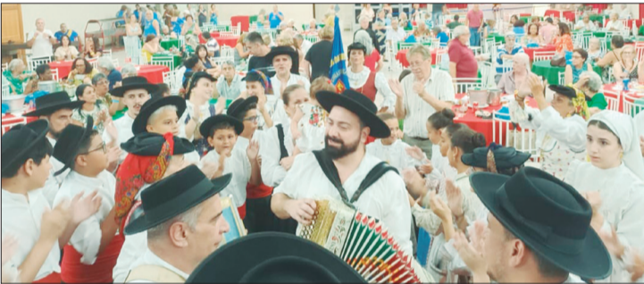
Apoteose desta tarde maravilhosa de folclore no solar feirense, com os componentes reunidos juntos a tocata numa explosão de alegria