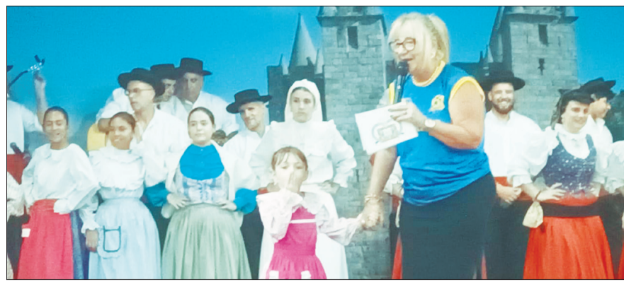
Belíssimo registro deste dia festivo do 37.º aniversário do R.F. I. J. Danças e Cantares das Terras da Feira