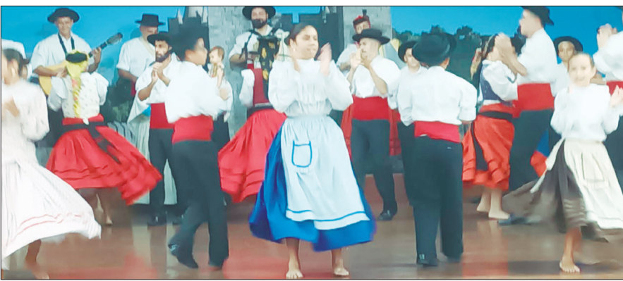
Lindo, simplesmente maravilhoso o espetáculo de folclore que o R.F.I.J. Danças e Cantares das Terras da Feira deu, no dia do seu aniversário