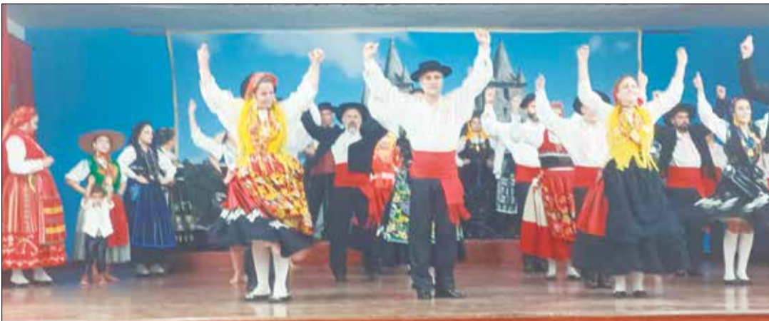
Que espetáculo foi o Arraial Feirense -Quinta do Castelo, simplesmente uma tarde maravilhosa