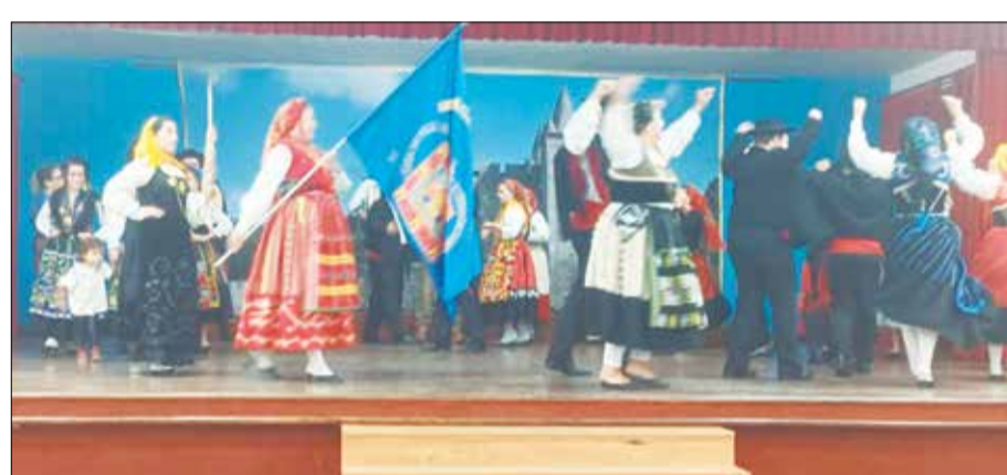
Sem duvida alguma a cada apresentação os componentes Rancho Folclórico brilham, cada vez mais parabéns