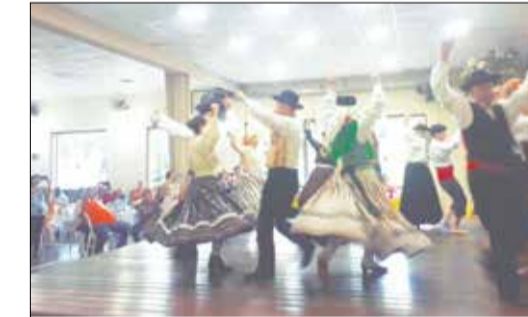
Que show, que performance do Rancho Camponeses de Portugal. Alegria reinou durante esta linda festa regional em Duque de Caxias