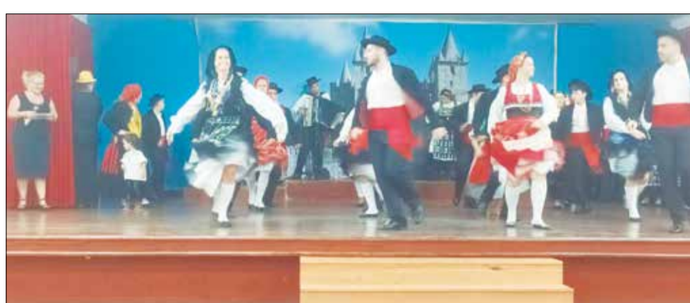
Esse show do Rancho Folclórico Almeida Garrett vai ficar para a história

ta maravilhosa e o mais legal é que a comunidade portuguesa prestigiou em peso. Uma tarde de muitos encontros entre amigos que foram desfrutar do delicioso cardápio e do maravilhoso show de folclore do Rancho Almeida Garrett.