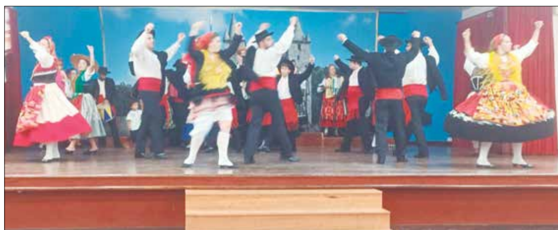
Imagem fantástica do Rancho Almeida Garrett, nesta tarde de domingo no Castelo da Feira