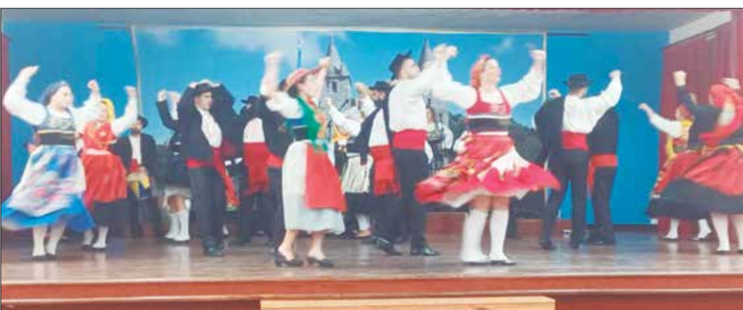
Apresentação de gala do Rancho Folclórico Almeida Garrett que show dos seus componentes