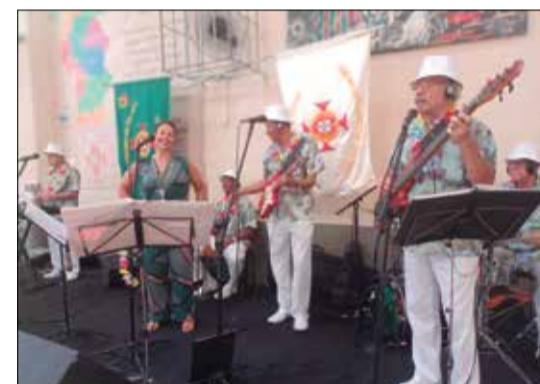
Mais uma maravilhosa apresentação da Banda T.B. Show, com um bellissimo repertório em ritmo de carnaval