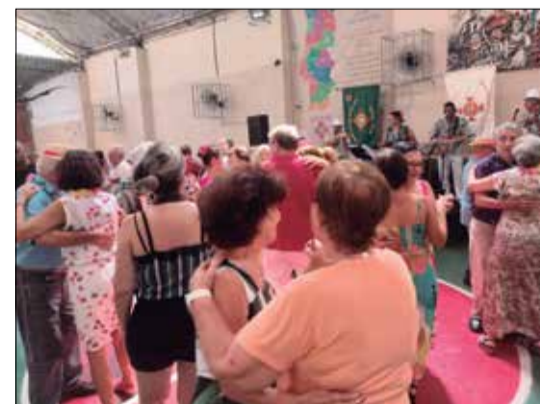
Panorâmica do Baile do Havai no Orfeão Português