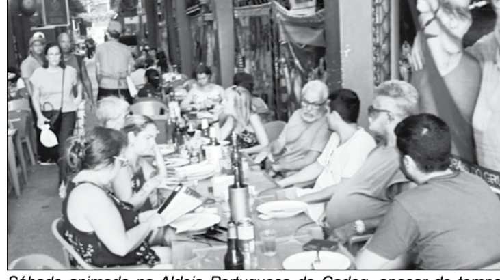
Sábado animado na Aldeia Portuguesa do Cadeg, apesar do tempo muito quente os amigos sempre prestigiando o cantinho das Concertina