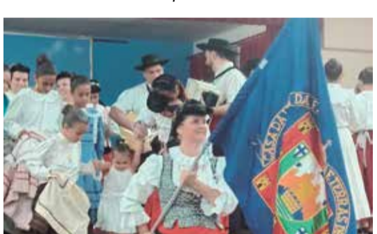
Depois da linda apresentação saída triunfal dos Ranchos Folclóricos Feirense