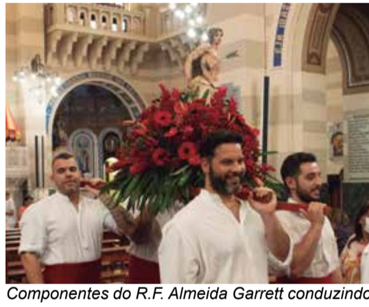
Componentes do R.F. Almeida Garrett conduzindo o andor com a imagem do Padroeiro da Casa da Vila da Feira São Sebastião