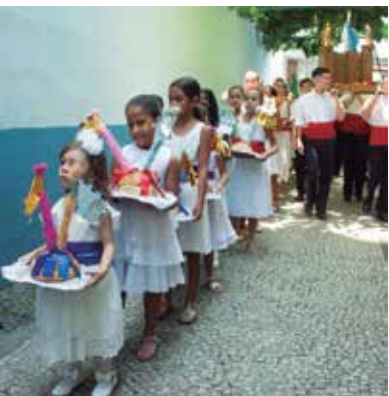
Linda imagens as crianças com as fogaças saindo da Casa da Vila da Feira para a Igreja dos Capuchinhos