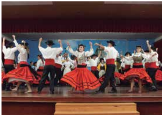
O Rancho Folclórico Almeida Garrett e brincadeira que apresentação um verdadeiro espetáculo, parabéns a todos os componentes