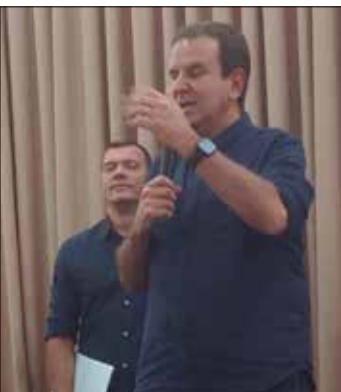
Prefeito da Cidade do Rio de Janeiro, Eduardo Paes, quando saudava a Comunidade Luso-brasileira