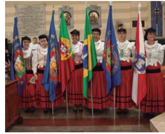
No interior da Igreja dos Capuchinhos, vemos as componentes do R.F. Almeida Garrett