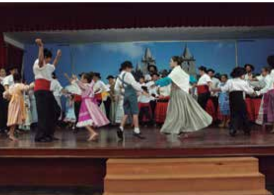
Que show das crianças do Rancho Folclórico, Infanto-Juvenil Danças e Cantares das Terras da Feira