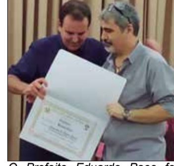
O Prefeito Eduardo Paes foi agraciado com o Título de Sócio Honorário da Casa de Trás-os-Montes, entregue pelo Presidente Ismael Loureiro