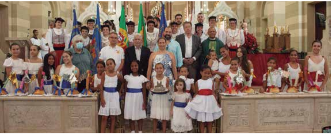
Tradicional foto na Igreja dos Capuchinhos, após a celebração religiosa com a Diretoria Feirense, componentes do R.F. Almeida Garrett e as crianças, com as Fogaças