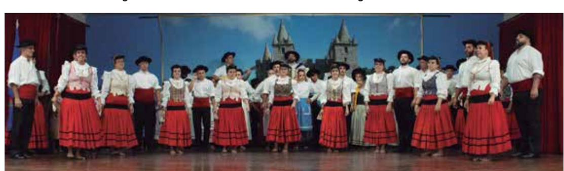
Tradicional foto dos componentes do R.F. Almeida Garrett reunidos em mais um verdadeiro espetáculo