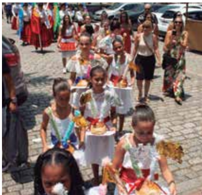
A chegada da Procissão a Igreja para Missa em Ação de Graças, a São Sebastião