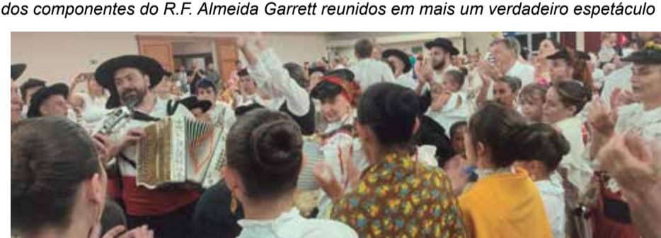
Explosão de alegria dos componentes dos Rancho Feirense no final do show