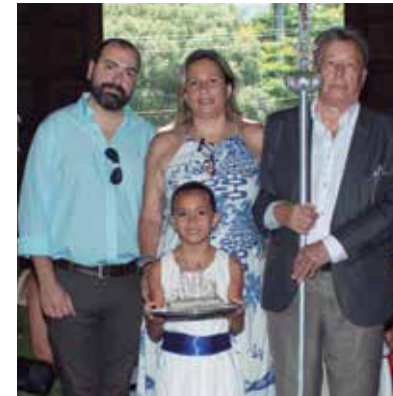
Belíssimo momento na Igreja dos Capuchinhos, onde vemos o Presidente Ernesto Boaventura a 1ª Dama Rose Boaventura, filha Camila e esposo Camilo Leitão