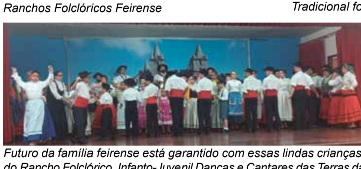
Futuro da família feirense está garantido com essas lindas crianças, do Rancho Folclórico, Infanto-Juvenil Danças e Cantares das Terras da Feira, dando sequência as tradições Portuguesas