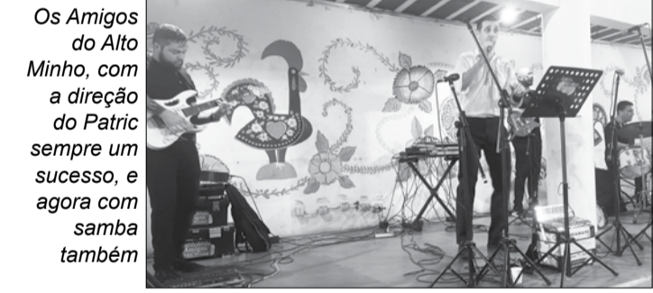
Os Amigos do Alto Minho, com a direção do Patric sempre um sucesso, e agora com samba também