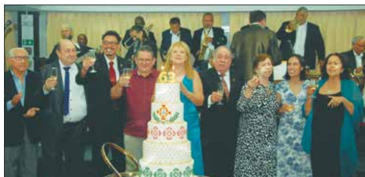
Comemoração geral na hora do bolo, os parabens ao Clube Portugues de Niteroi com a diretoria e os convidados brindando