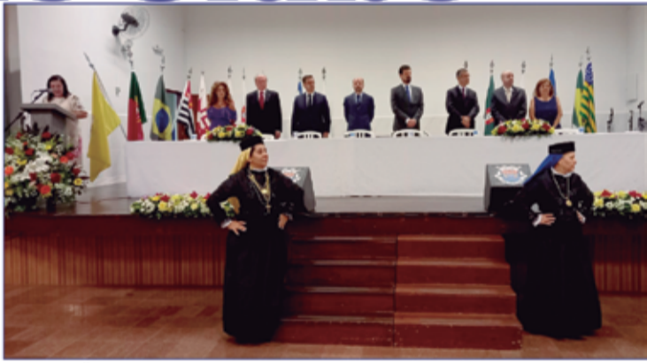
Composição da mesa de honra.