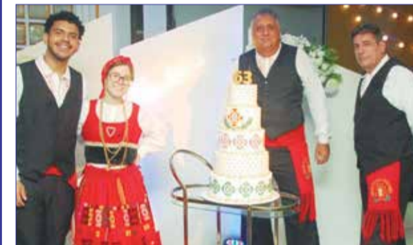
Na entrada recebendo os convidados um belo grupo do Rancho Luis de Camões