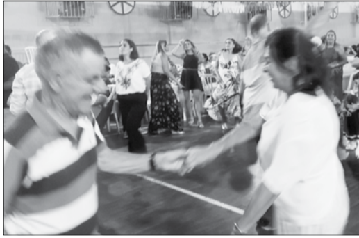
O publico animado como sempre na Quinta de Santoinho

dançar, fica pra próxima, mas a casa estava bem arrumada e registramos alguns momentos, no segundo sábado de abril lá estaremos.