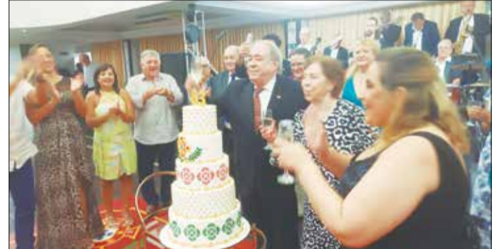
Na hora de soprar a velhinha , alis são 63 anos o Presidente e a Primeira Dama sopraram juntos para ter mais sorte ainda