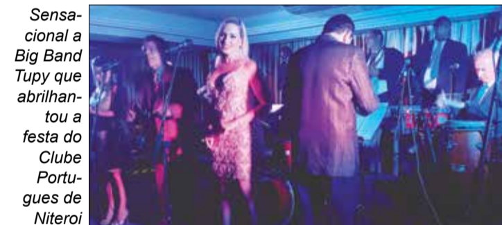
Sensacional a Big Band Tupy que abrilhantou a festa do Clube Portugues de Niteroi