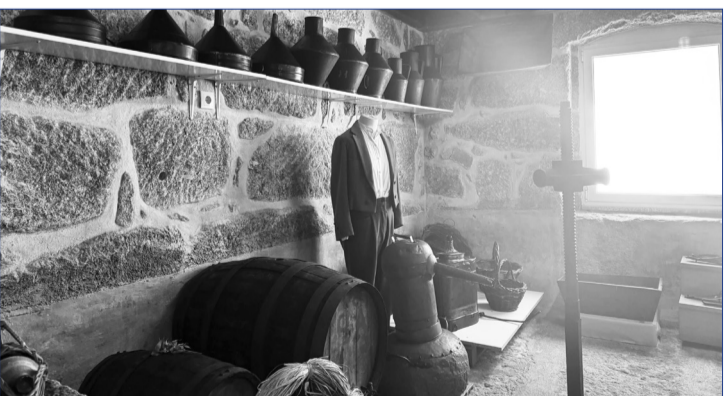
Entre tantos tesouros preservados no Museu Lopes Pires, em Silgueiros, encontramos verdadeiras relíquias que contam histórias, tradições e memórias de outros tempos. Cada peça representa um valioso património cultural, mantendo viva a identidade e a herança do nosso povo.