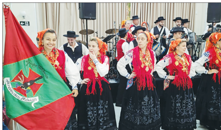
Belo registro das componentes do Grupo Folclórico Serões das Aldeias, perfiladas durante o Domingo de Fé em homenagem às mães, num momento de devoção, tradição e emoção