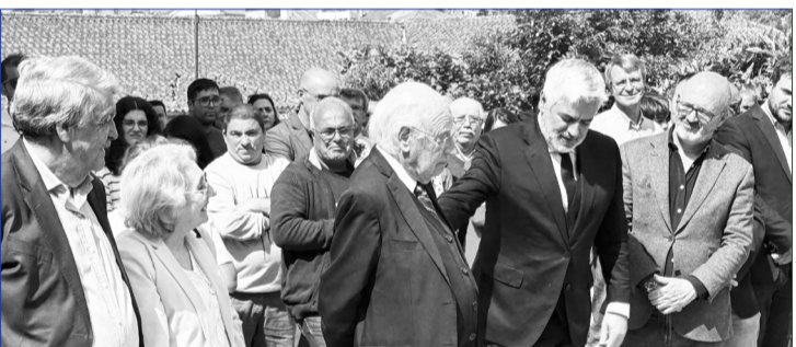
Foram momentos marcantes de uma festa especial para a população de Silgueiros, celebrando a história, a cultura e o reencontro da comunidade em torno do seu património.

A Confraria “Grão Vasco” felicitou igualmente a ASSOPS – Associação de Passos de Silgueiros pelo trabalho realizado na recuperação e valorização deste importante espaço museológico, destacando o papel fundamental da associação na preservação da história e das tradições da comunidade.