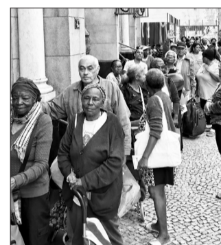
Os assistidos aguardando, com esperança e fraternidade, o início da distribuição das cestas básicas promovida pela Venerável Irmandade Santo Antônio dos Pobres