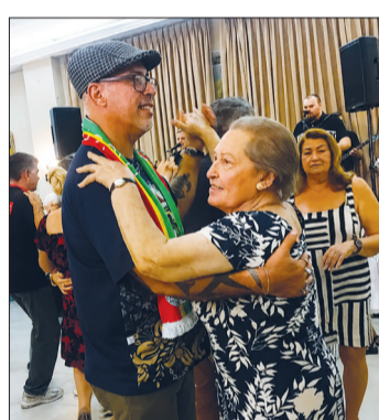
Os dançarinos aproveitaram para tomar conta da pista e deram mais um show de animação ao som do conjunto Amigos do Alto Minho, levando alegria e muita descontração ao evento