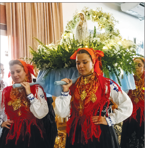
Momento de fé, emoção e tradição: a entrada da imagem de Nossa Senhora no salão da Casa de Trás-os-Montes e Alto Douro emocionou os presentes, conduzida com delicadeza e devoção pelas lindas componentes do Grupo Folclórico Serões das Aldeias