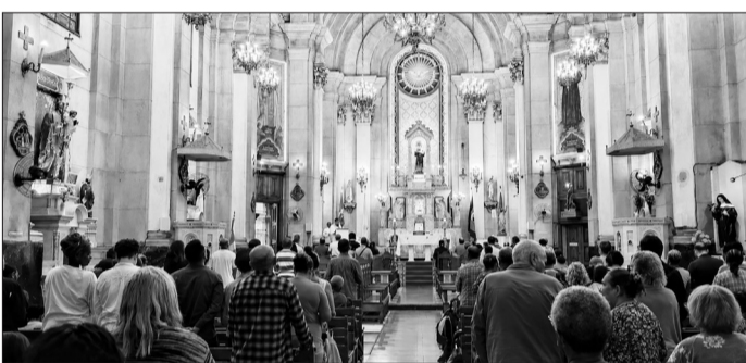
Os assistidos aguardando, com esperança e fraternidade, o início da distribuição das cestas básicas promovida pela Venerável Irmandade Santo Antônio dos Pobres

Em mais uma demonstração de fé cristã e compromisso com o próximo, a Venerável Irmandade Santo Antônio dos Pobres realizou, no dia 26 de maio, no Rio de Janeiro, uma importante ação social em benefício de famílias e pessoas em situação de vulnerabilidade.