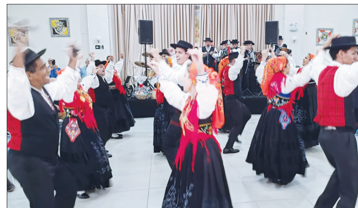
Uma bellissima apresentação do Grupo Folclórico Serões das Aldeias, que encantou o público no domingo passado, no Solar Transmontano, levando ao palco a beleza da cultura e das tradições portuguesas