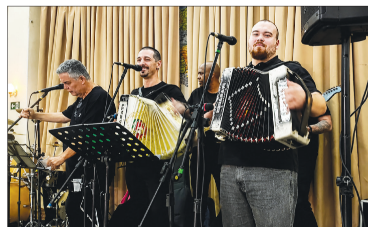
Realmente, o conjunto Amigos do Alto Minho está cada vez melhor, sempre animando o público com um repertório variado, muita alegria, descontração e ritmo contagiante. Parabéns por mais uma grande apresentação!