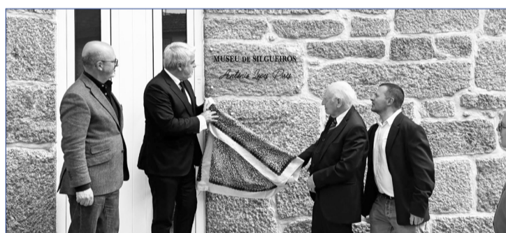
Momento do descerramento da placa comemorativa no Museu de Silgueiros, assinalando uma ocasião marcante para a valorização da cultura, da história e da identidade local. Na imagem, vemos a presença de diversas autoridades e convidados que se associaram a este importante momento para a comunidade de Silgueiros e para o concelho de Viseu.

continua profundamente presente entre todos aqueles que partilharam consigo o amor pelas tradições, pela cultura popular e pela defesa das raízes beirãs. A sua dedicação permanece como inspiração para as novas gerações e para o trabalho contínuo desenvolvido pela Confraria.