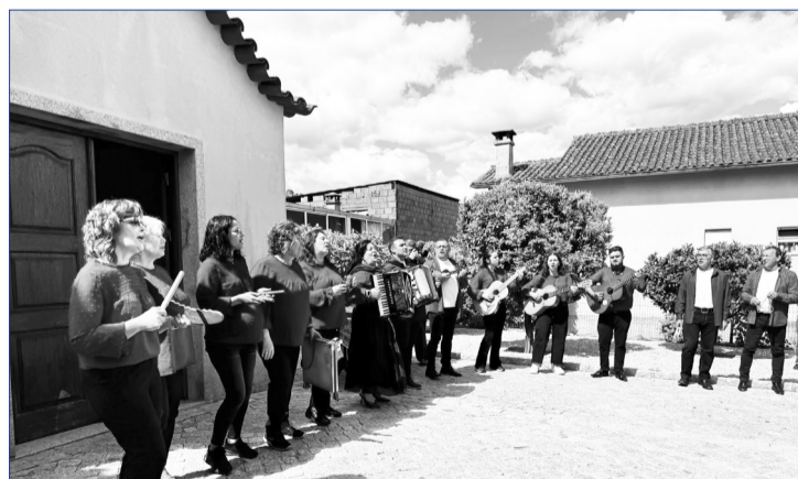
Não faltou animação e boa música neste dia tão especial! A turma saltou a voz e deu ainda mais alegria à inauguração do Museu em Silgueiros, num momento de convívio, tradição e muita emoção