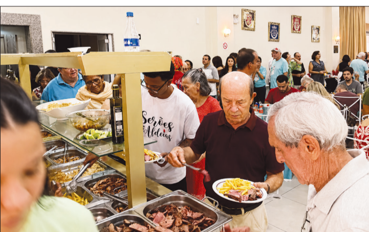
Um delicioso cardápio foi preparado para os amigos da comunidade portuguesa e luso-brasileira. Uma verdadeira delícia! Parabéns aos mestres da cozinha da Casa de Trás-os-Montes e Alto Douro, que mais uma vez deram um show de sabor