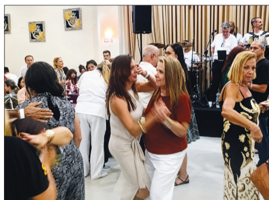
O salão ficou pequeno para tanta felicidade, alegria e animação dos presentes, que aproveitaram cada momento ao som contagiante do Conjunto Amigos do Alto Minho, em uma tarde festiva inesquecível