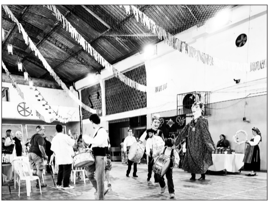
Momento tradicional da entrada dos gigantones, acompanhados pelos componentes da tocata com seus bumbos, que deram o ritmo e a animação à noite minhota