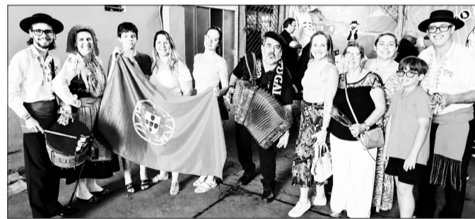
A cultura portuguesa dá o tom dos sábados à tarde no CADEG. Entre sabores, música o polo gastronômico se transforma em um verdadeiro encontro da comunidade luso-brasileira. Imperdível!

Mais do que um programa gastronômico, os sábados no CADEG tornaram-se um encontro marcado um espaço de celebração das raízes, da cultura e da amizade entre Brasil e Portugal. Uma tradição que cresce a cada semana e que já faz parte do calendário afetivo da comunidade.