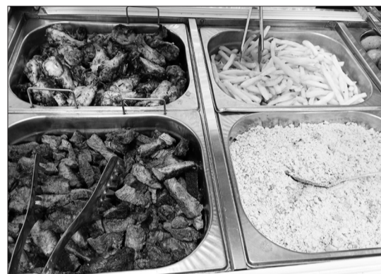
Um delicioso e caprichado cardápio foi especialmente preparado para celebrar este dia tão especial, homenageando com muito carinho as nossas queridas mães na festiva comemoração da Casa de Espinho