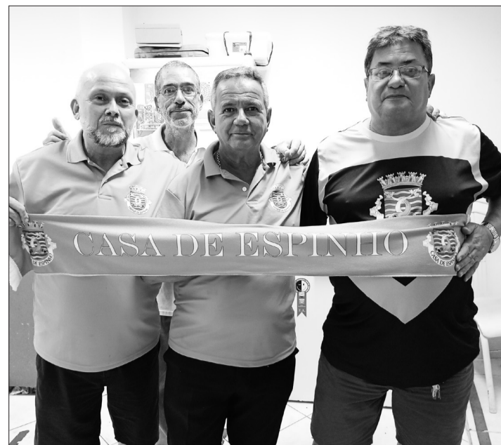
Diretores da Casa de Espinho em momento especial de confraternização, marcando presença na grande celebração do Dia das Mães, em destaque para o Jornal Portugal em Foco.

Em clima de fé e devoção, a tarde também reservou uma linda homenagem à Nossa Senhora de Fátima, fortalecendo ainda mais o espírito de união, esperança e gratidão vivido durante o encontro. Sem dúvida, a celebração do Dia das Mães na Casa de Espinho foi marcada pelo sucesso, pela forte presença da comunidade portuguesa e pela valorização das tradições que unem gerações em torno da cultura e da família.