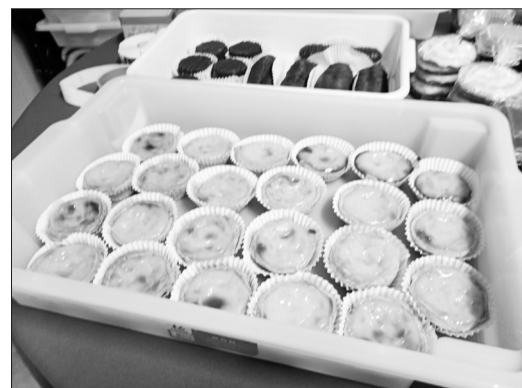
Também não faltaram os deliciosos doces portugueses, que fizeram sucesso entre os convidados e foram saboreados com muito prazer por todos os amigos presentes na festiva homenagem às mães na Casa de Espinho.