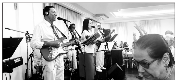
Quem comandou o ritmo musical no Dia Festivo das Mães na Casa dos Açores foi a animada banda Típicos da Beira Show, levando alegria, dança e muita animação ao público presente durante toda a celebração