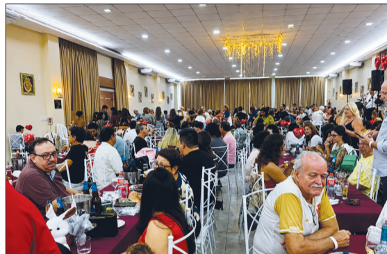
Panorâmica de um dia maravilhoso e especial em homenagem ao Dia das Rainhas do Lar, marcado por celebração, carinho e reconhecimento a todas as mães