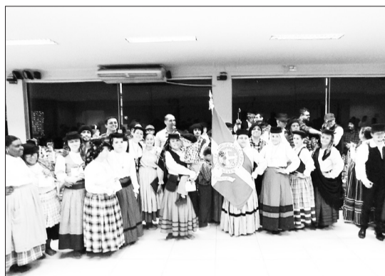
Linda imagem dos componentes do Grupo Folclórico Fausto Neves da Casa de Espinho reunidos neste dia tão especial, durante a festiva e emocionante homenagem dedicada às mães, marcada pela alegria, tradição e espírito de união