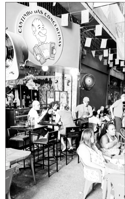
Panorâmica do público prestigiando o restaurante Cantinho das Concertinas, em uma sábado repleto de música, cultura, tradição e sabores portugueses.