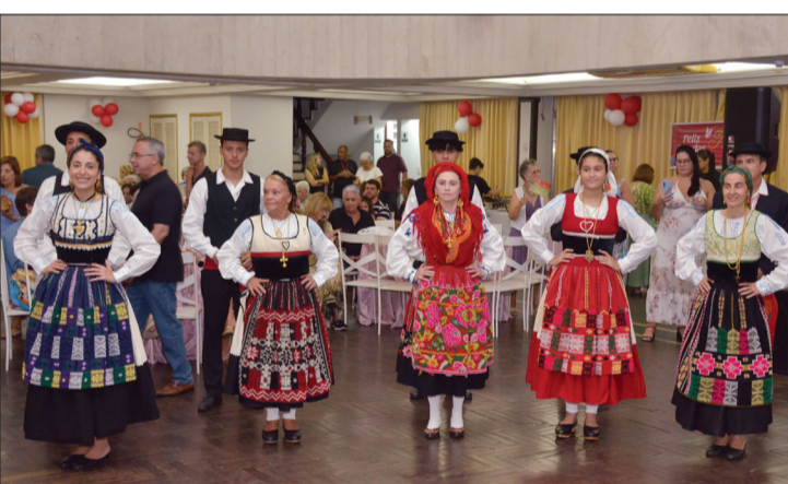
Belíssima participação do Rancho Folclórico Luís de Camões no domingo festivo em homenagem às mães, abrilhantando com tradição, alegria e cultura esta tarde inesquecível