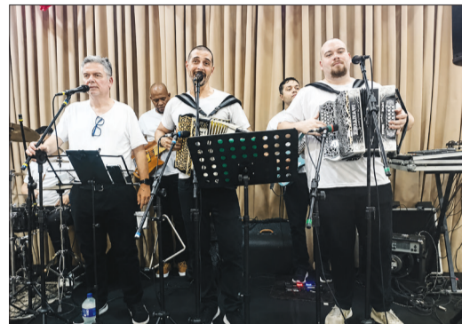
O Conjunto Amigos do Alto Minho deu um toque especial e cheio de charme musical à tarde festiva em homenagem às mães, animando o evento com muita alegria e boa música

te lotada, demonstrando a força da comunidade transmontana e o carinho dos associados pela entidade.