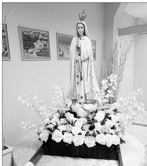
Em um momento de fé e emoção, Nossa Senhora de Fátima foi homenageada durante a celebração do Dia das Mães na Casa de Espinho, fortalecendo os laços de devoção, amor e união entre as famílias presentes

A animação musical ficou por conta do talentoso Conjunto Musical Fernando Santos da Concertina Nota 10, que colocou o público para cantar e dançar ao som de