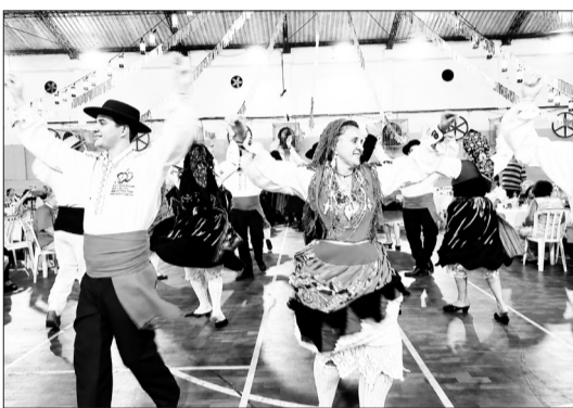
O Rancho Folclórico Maria da Fonte realizou uma belíssima e emocionante apresentação na Quinta de Santo Antônio, encantando o público presente com danças tradicionais, trajes típicos e toda a riqueza da cultura popular portuguesa.